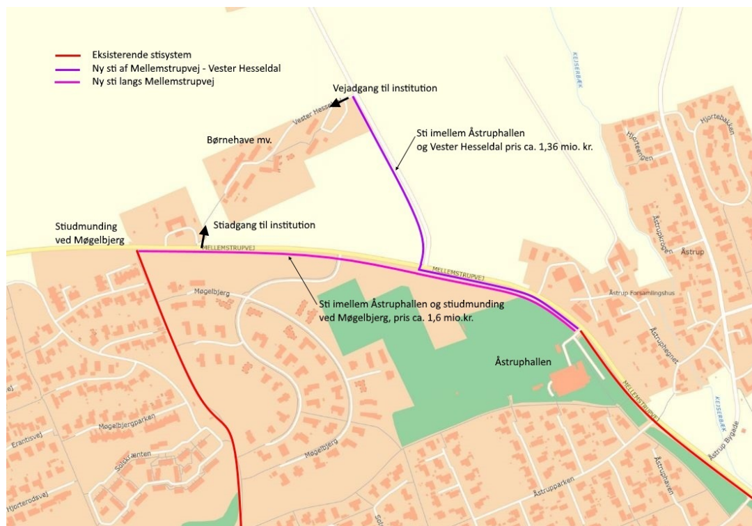
Mulige stianlæg mellem Åstrup hallen og institutionerne

Pris på en dobbelrettet cykelsti på ca. 800 m. = 1.600.000 kr.