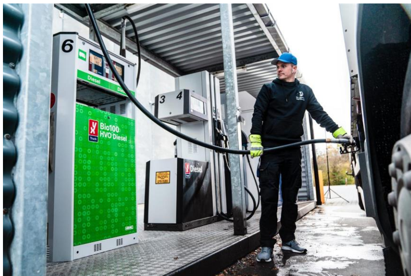
Figur 3-1 HVO-tankstation i Ishøj.