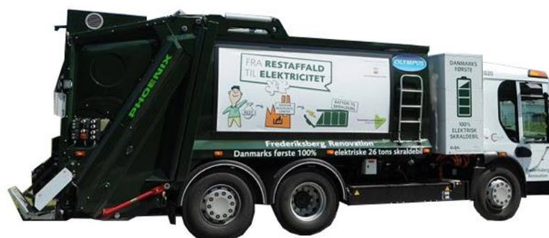
Figur 3-2 Elektrisk renovationsbil.

Støjniveauet fra en eldrevne renovationsbil er målt til ca. 65 dB, dvs. væsentligt lavere end for dieslbiler. Samtidig er der ingen lokal luftforurening fra eldrevne biler. Disse to faktorer medfører et forbedret arbejdsmiljø for renovationsmedarbejderne.