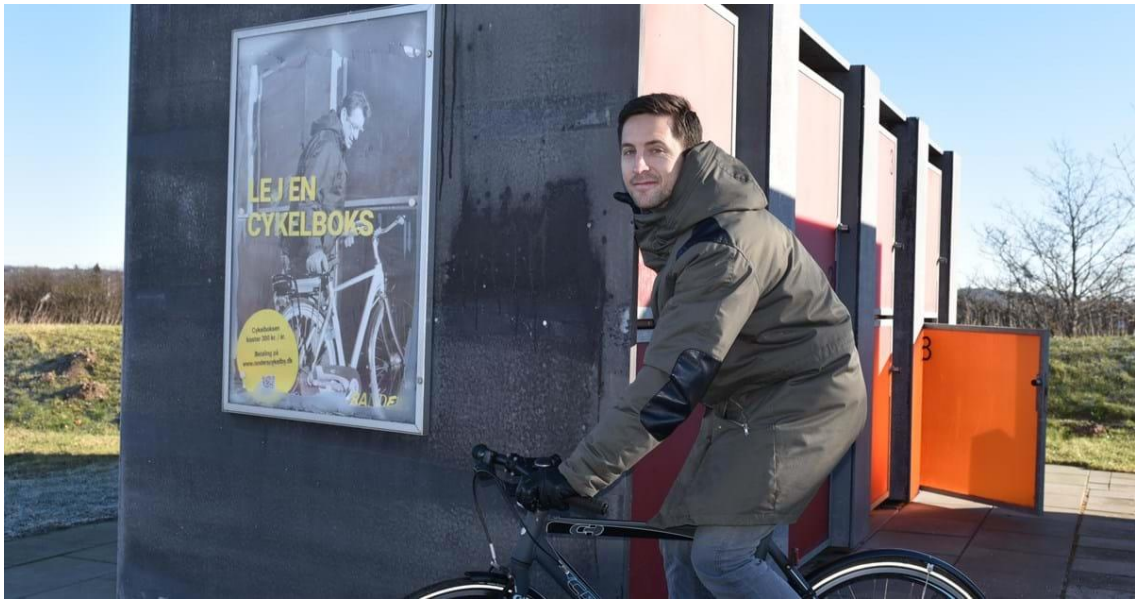
Cykelbokse i Randers Kommune som inspiration.