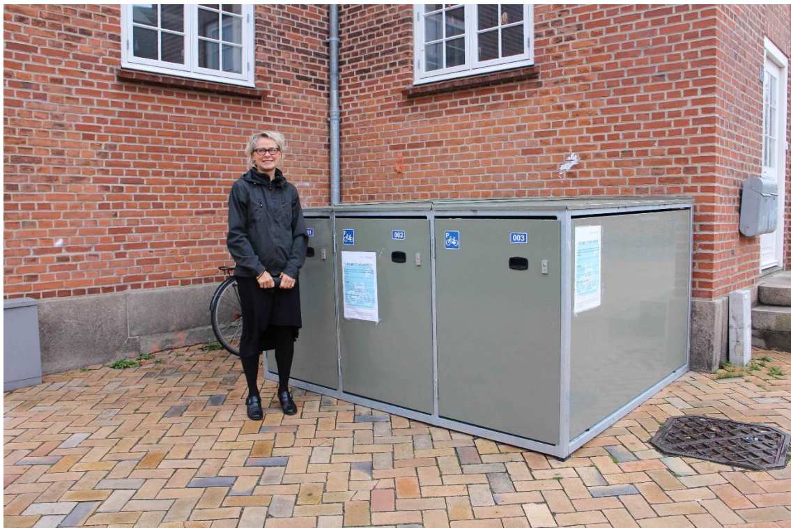
Cykelbokse i Sønderborg Kommune som inspiration.