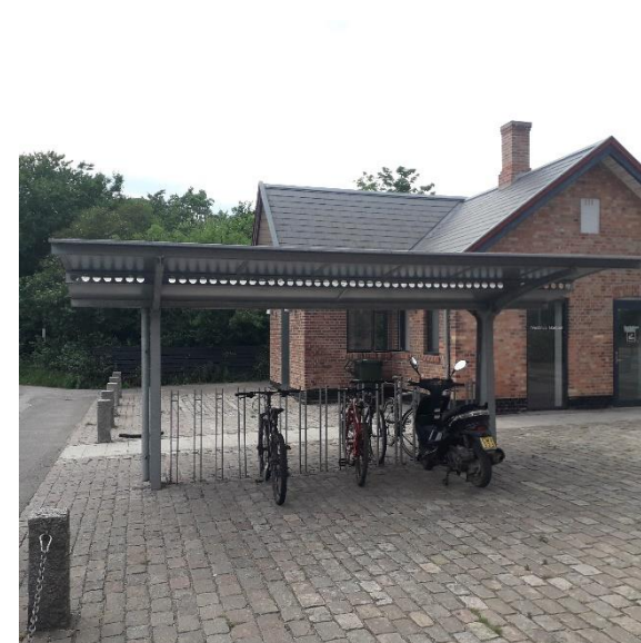
Cykelparkeringen i Trustrup, henholdsvis i bygningen øverst og på stationspladsen nederst.