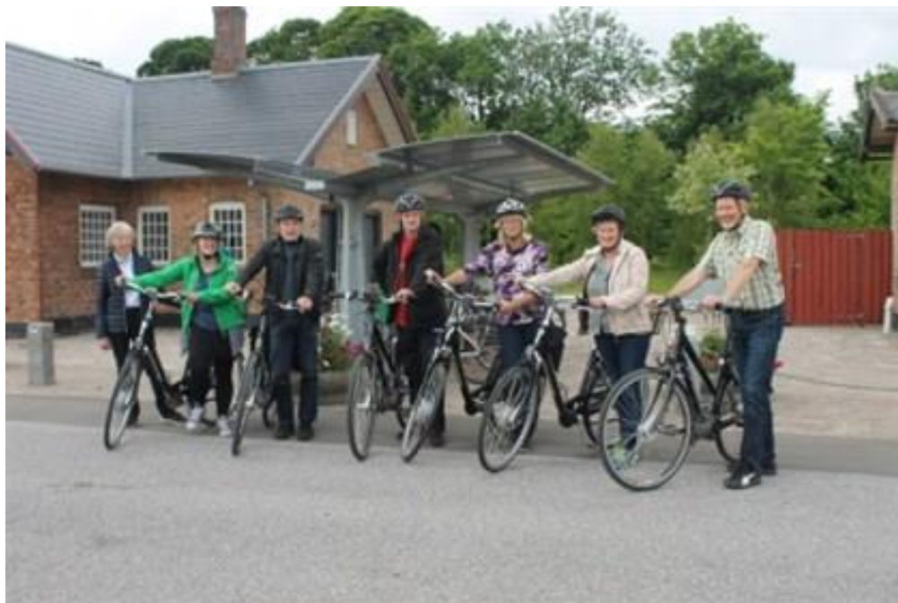
Elcykeltestere i Trustrup i 2015

I 2014 – 2016 udførte Norddjurs Kommune et projekt kaldet Cykellandsbyen Trustrup-Lyngby med støtte fra Landdistriktspuljen. Heri blev der blandt andet indkøbt el-ladcykler til skolen, og en gruppe borgere testede elcykler i en periode på ½ år. Efterfølgende har gruppen stabledet en elcykelforening på bagen, som stadig findes, og blandt ved åbningen af letbanestationen i Trustrup i maj 2019 stod klar med udlån af elcykler. Grundet projektet er der en forholdsvis stor andel af elcykler i lokalområdet, som skal have bedre parkeringsforhold på stationen.