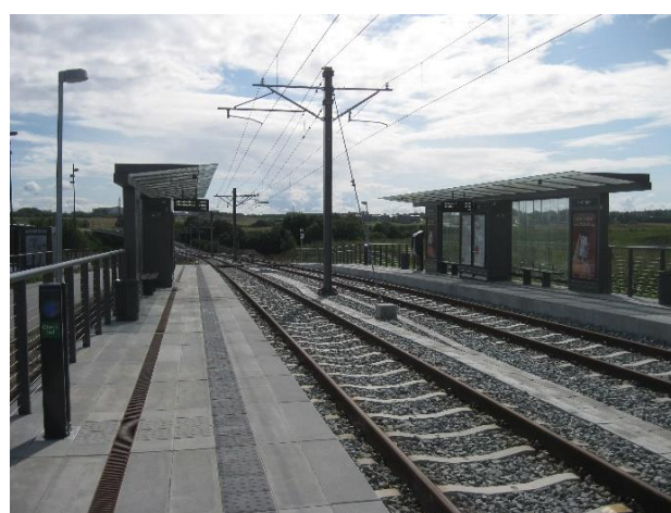
Klokhøjen Station i Aarhus Kommune th og Hessel Station tv i Norddjurs Kommune er udført i ensartede elementer.