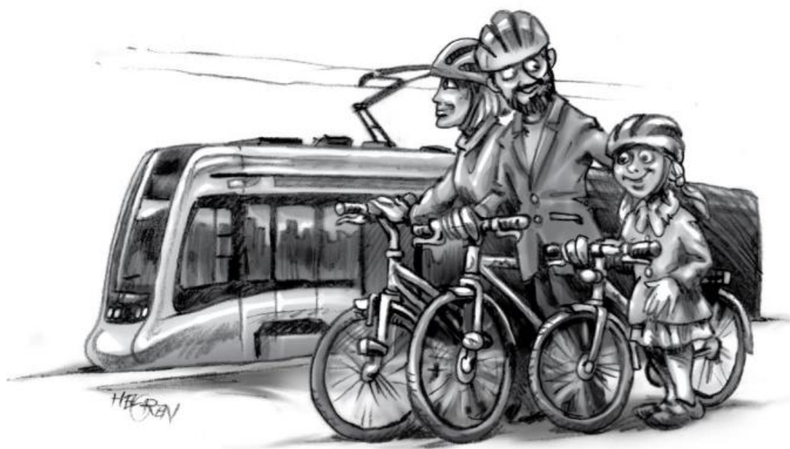
Illustration fra Djurs Mobilitetsstrategi (2016)