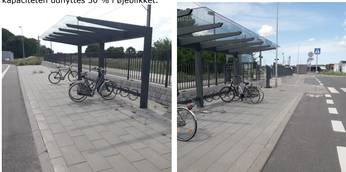
Overdækket cykelparkering på Hessel Station i det sydlige Grenaa.

Der er 12 overdækkede cykelparkeringspladser på Hessel Station. Det vurderes at kapaciteten udnyttes 30 % i øjeblikket.