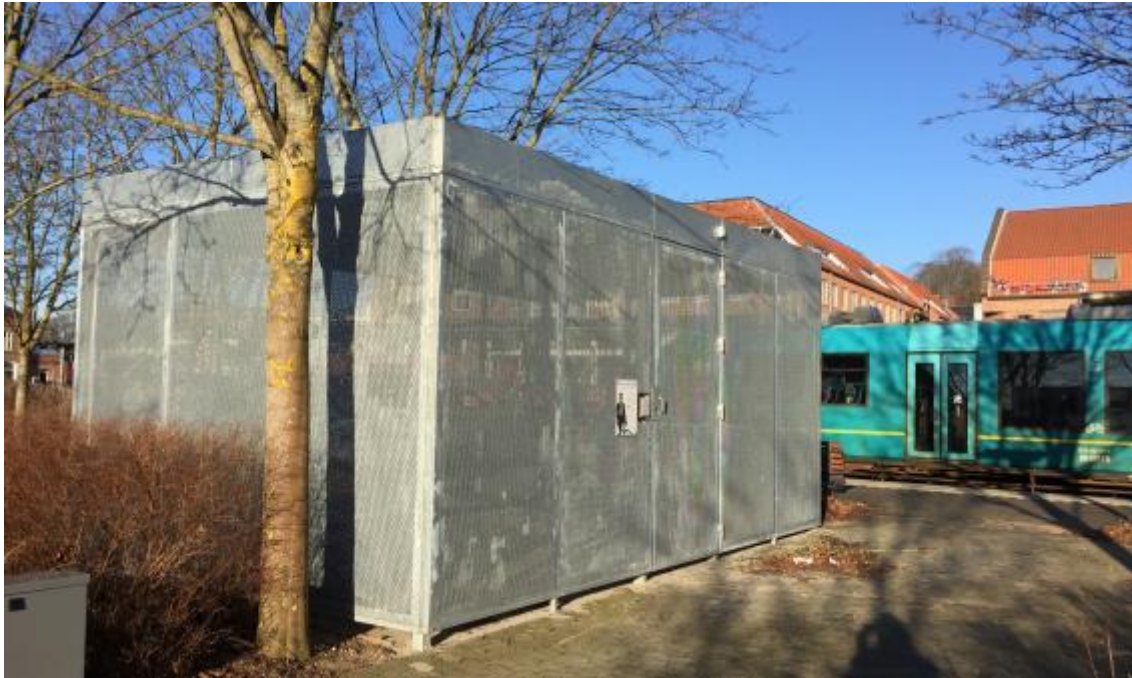
Aflåst cykelparkering i Hadsten, som betjenes med rejsekort.