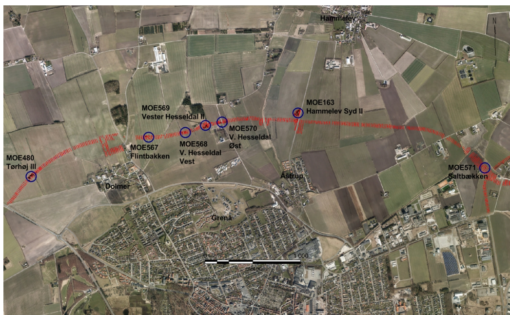
Museum Østjylland Årbog 2016, "Omfartsvejen ved Grenaa – en præsentation af udgravningerne".

Billedtekst: Alle søgegrøfterne på omfartsvejen er markeret med rødt. De syv udgravninger er markeret med blå cirkler.