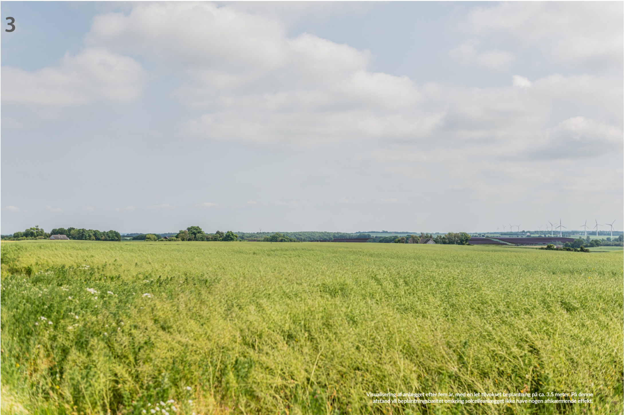
Visualisering af anlægget efter fem år, med en let tilvokset beplantning på ca. 3,5 meter. På denne afstand vil beplantningsbæltet omkring solcelleanlægget ikke have nogen afskærmende effekt.