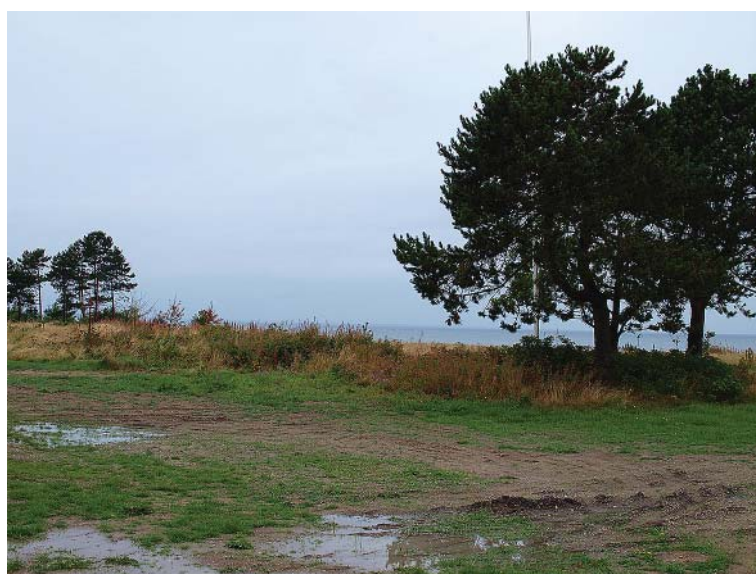
OMRÅDE VED HEGEDAL STRAND

Den tidligere campingplads, Hegedal Strand Camping, lukkede i 2015. Ejendommen er efterfølgende solgt. I denne forbindelse er der tidligere givet tilladelse til at udstykke 4 sommerhusgrunde fra ejendommen. De nuværende ejere ønsker nu, at de 4 eksisterende parceller kan deles til i alt 8 sommerhusgrunde. Norddjurs kommunalbestyrelsen har den 19. april 2016 behandlet en forespørgsel vedrørende deling af de nævnte 4 sommerhusgrunde. Kommunalbestyrelsen besluttede, at der inden der kan udstykkes yderligere sommerhusgrunde i området, skal der udarbejdes en lokalplan for det samlede område hvor den tidligere campingplads ved Ravnsvej 3, Hegedal Strand, har ligget.