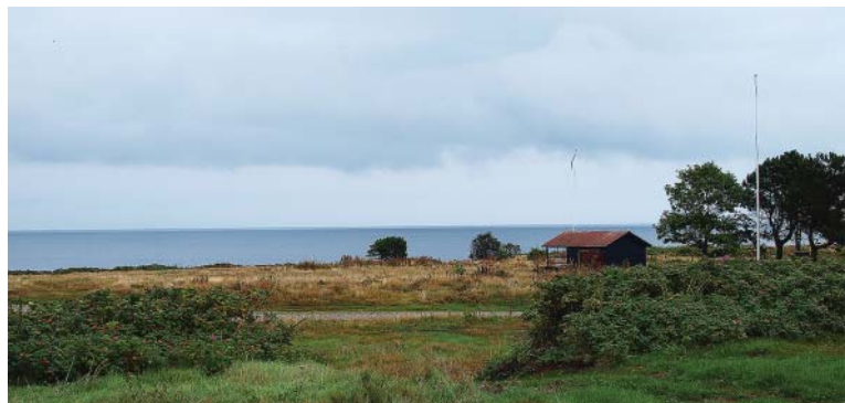
OMRÅDE VED HEGEDAL STRAND

Norddjurs Kommune har foretaget screening af nærværende lokalplan og vurderer som planmyndighed, at planen ikke vil få væsentlig indvirkning på miljøet. Planen skal derfor ikke miljøvurderes.