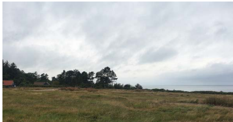
OMRÅDE VED HEGEDAL STRAND

Lokalplanen vil dog ikke påvirke Natura 2000 området yderligere. Friholdelsen af delområde 1 for bebyggelse (tidligere anvendt til camping) kan fremme områdets brug for bilag IV arter.