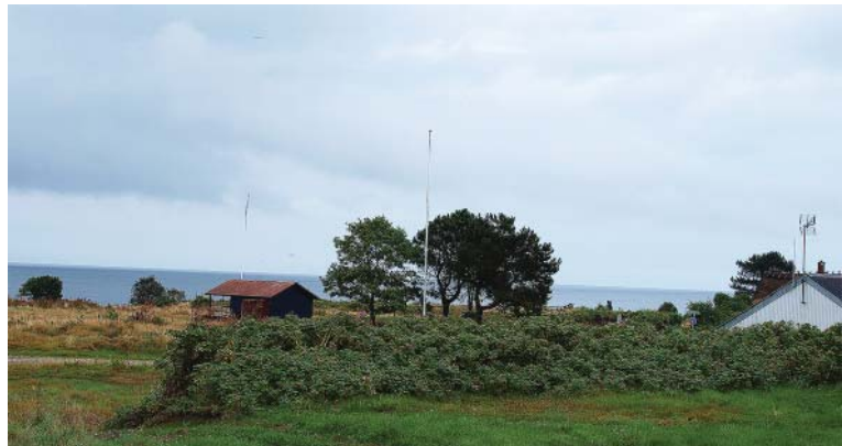
OMRÅDE VED HEGEDAL STRAND

I området findes der to mindre områder med trægrupper, samt en hæk forløbende fra vest til øst.