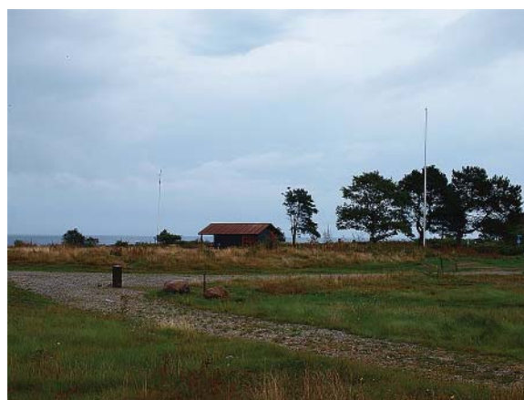
OMRÅDET MED KIK MOD HAVET