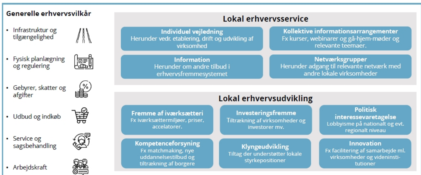
Figur 1, viser virkemidler i den lokale erhvervsindsats indenfor områderne generelle erhvervsvilkår, lokal erhvervsservice og lokal erhvervsudvikling:

indenfor styrkepositionerne med potentiale. Udviklingskræfterne og løsningerne kan meget vel befinde sig uden for kommunen, når det gælder erhvervspolitiske satsninger, til eksempel Business Region Aarhus og EU-kontoret. Opmærksomheden på mulighederne for at tiltrække regionale, nationale og internationale investeringer og ressourcer er vigtig. Det gælder ikke mindst i forhold til mere langsigtede udviklingsopgaver og muligheder. På den måde rækker egne ressourcer længere.