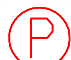
Mellemstation 4 Højbjergvej