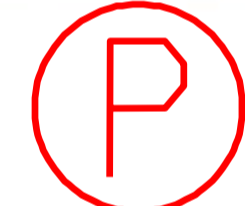
Mellemstation 3 Ballegaard