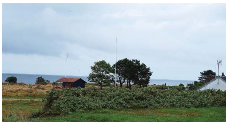
OMRÅDE VED HEGEDAL STRAND

I området findes der to mindre områder med trægrupper, samt en hæk forløbende fra vest til øst.