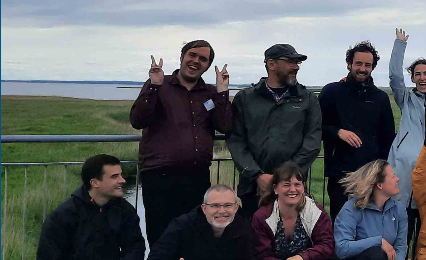
TREASURE partnernøde i Danmark. TREASURE har til formål at forhindre udstrømning af plastaffald fra åer og floder til Nordsøen.