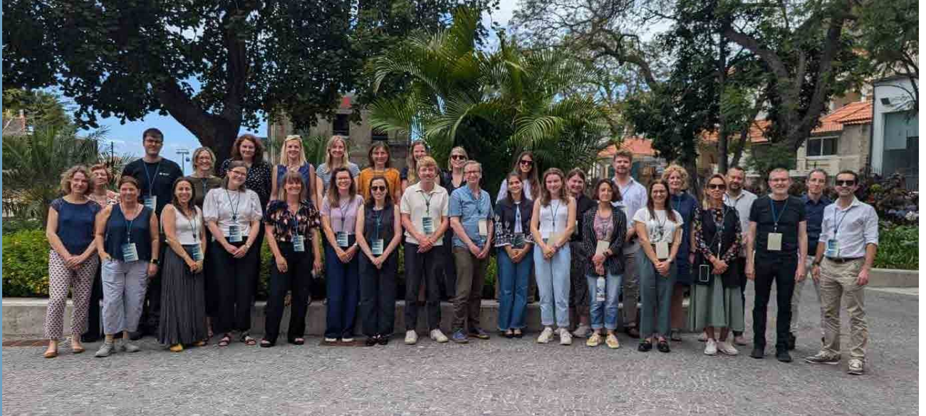
OSPAR arbejdsgrupper mødtes om reduktion af marint affald i det nordøstlige Atlanterhav.