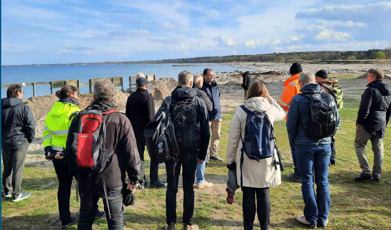
KIMO's bestyrelse på studietur ved Køge Bugt.