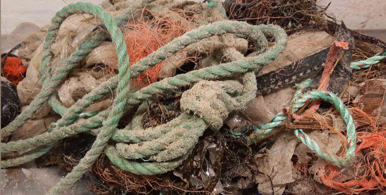
Affald fundet ved 100 m overvågningsstrand i Nymindegab.