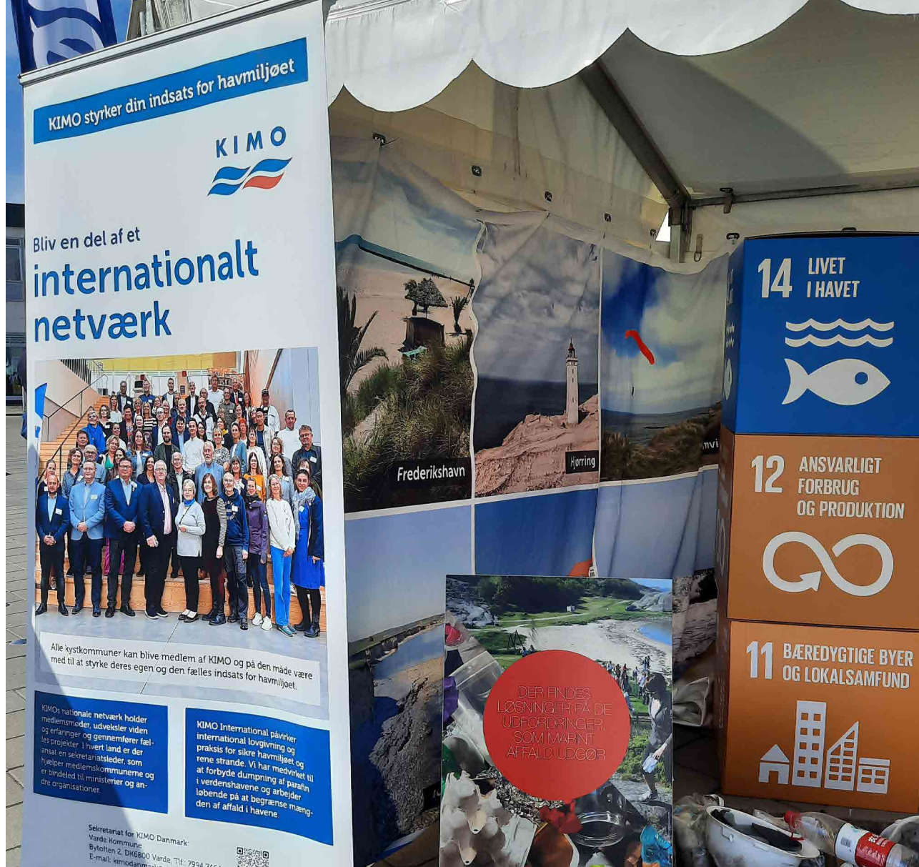
KIMO Danmarks telt på Naturmødet 2024.

Koordinatoren blev interviewet på DR Nordjylland, DR TV og Radio III om sagen og især, at Mærsk indstillede deres eftersøgning af de sidste tabte containere i marts 2024.