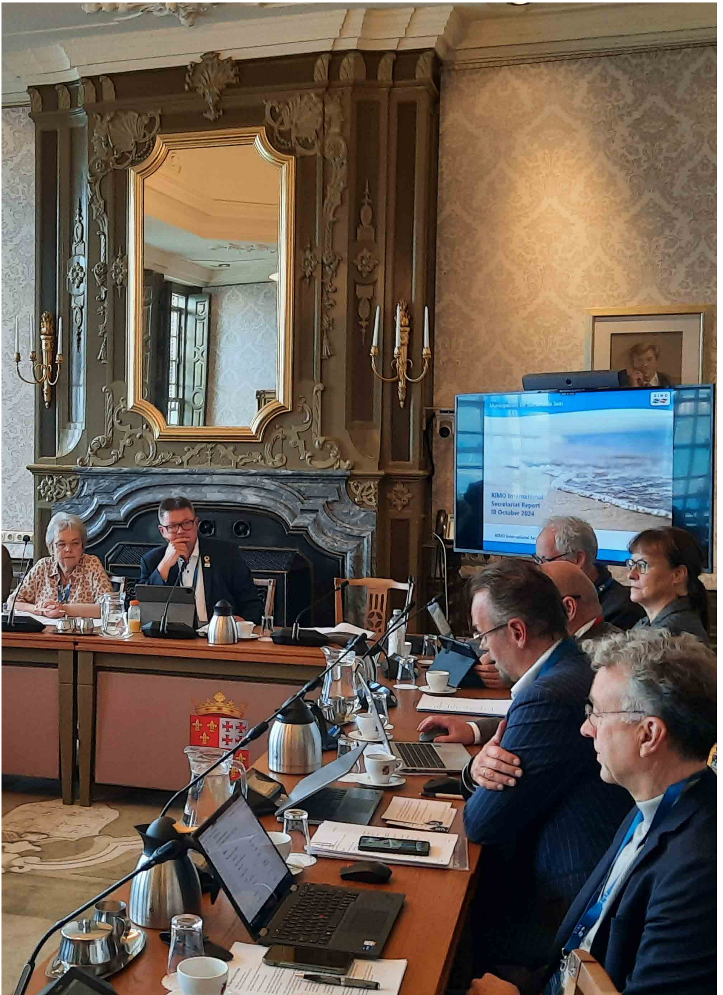
Bestyrelsesmøde i KIMO International afholdt i Harlingen Holland.