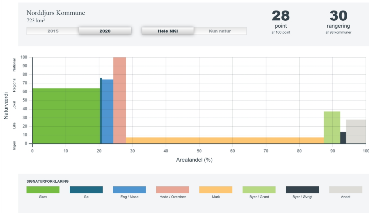
Figur 2 Norddjurs Kommunes Naturkapitalindex i 2020

Hvis man ønsker, at gå ”bagom data”, er der pt. kun tilgængelige data fra undersøgelsen fra 2015. Her er kommunerne opdelt i tre hovedtyper: bykommuner, landbrugskommuner og kommuner med særlig meget natur (naturkommuner). Det giver bedst mening at sammenligne kommuner med samme udgangspunkt. Nedenstående tabel viser de kommuner, der er mest sammenlignelige med Norddjurs Kommune. Jo tættere sammenligningskommunen er på tallet 1, jo mere ligner den og Norddjurs Kommune hinanden.