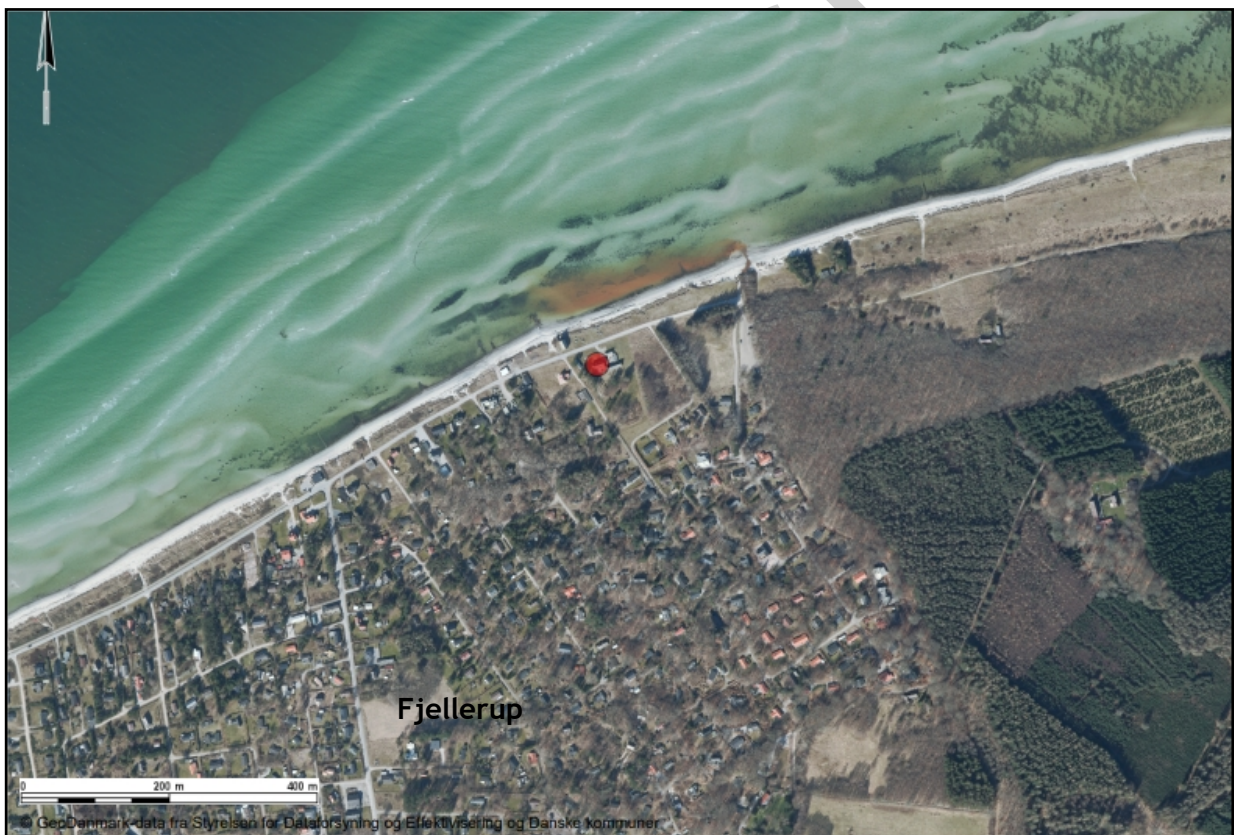
Luftfoto visende ejendommens, Klitvej 120 beliggenhed i Fjellerup (rød prik)

Norddjurs Kommune meddeler hermed landzonetilladelse efter planlovens § 35, stk. 1, til etablering af en oplevelsesplads, bådebro og bundgarnspæle på ejendommen beliggende Klitvej 17 og 120, 8585 Glesborg. Oplevelsespladsen etableres på matr.nr. 25ds Fjellerup By, Fjellerup (Klitvej 17, på stranden og på søterritoriet).