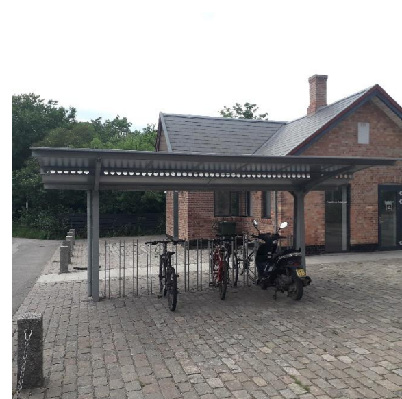
Cykelparkeringen i Trustrup, henholdsvis i bygningen øverst og på stationspladsen nederst.