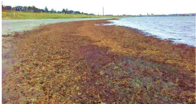
Grenaa Strand med tang

Ved en besparelse vil Driftscentret stoppe med at fjerne tang, og der vil ikke være livreddere til stede på Grenaa Strand i højsæsonen. Som strandgæst kan man ikke forvente, at stranden er renholdt, uden tang og indbydende at færdes eller tage ophold på. Bevoksningen fra klitterne vil brede sig ned over stranden og gøre strandarealet smallere. På varme sommerdage vil man opleve lugten af rådden tang; dette vil også gælde beboere nær stranden. Norddjurs Kommune vil miste Blå Flag-mærkningen og desuden opleve et faldende antal turister, sommerhusgæster og besøgende til kommunen, på grund af strandenes fremtoning og manglen på faciliteter.