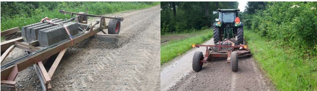
Arbejde på grusvej

Besparelse på budgettet vil kun kunne gennemføres ved færre overkørsler, og en eventuel sænkning af hastighedsgrænserne på de dårligste veje, eller der opstilles advarselsskilte om "huller i vejen". Besparelsen i budgettet vil ligge på løn og maskiner.