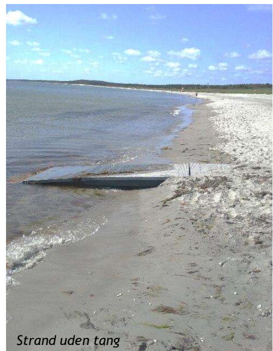
Strand uden tang

Der fjernes sand efter behov fra handicapadgangene året rundt.