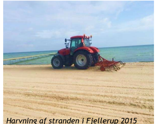
Harvning af stranden i Fjellerup 2015

Budget 2024 kr. 727.220 Budget 2023 kr. 664.073 Budget 2022 kr. 816.636 Budget 2021 kr. 833.006 Budget 2020 kr. 645.000