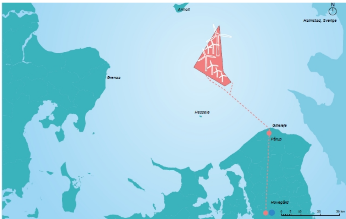
Billede 1. Hesselø Havvindmøllepark er markeret med rødt på ovenstående kort. Kortet stammer fra høringsmaterialet.

Norddjurs Kommune har modtaget en høring i forbindelse med udarbejdelse af en afgrænsningsrapport i forbindelse med opstilling af Hesselø Havvindmøllepark (ca. 19,5 km fra Anholt's kyst), se placering på nedenstående kort.