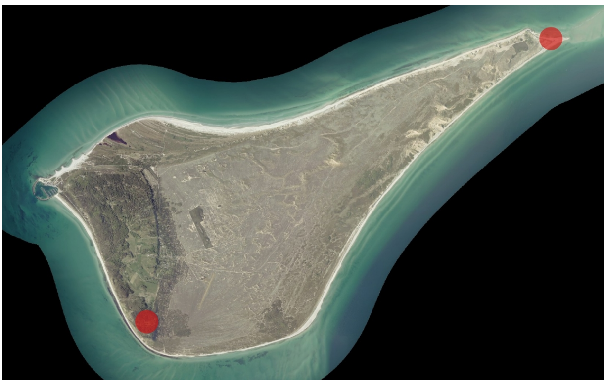
Billede 2. De røde markeringer viser de to ønskede visualiseringspunkter.