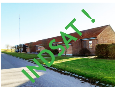
Udlejningsboliger ved Søndervang

Lokalplanens bestemmelser lægger desuden en række begrænsninger på brug af materialer, som i farve eller karakter ikke naturligt hører hjemme i et landsbykontekst, da landbrugslandskabet gerne må være det dominerende element.