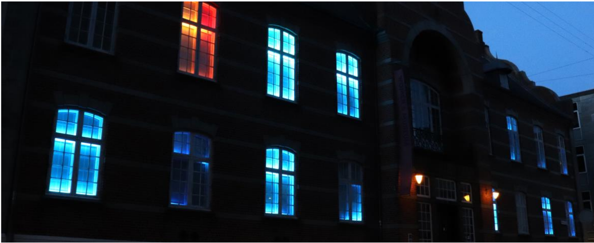
Zeitgeist, en facadeudsmykning der bevæger sig styret af vindens hastighed omkring bygningen. Signe Klejs 2019