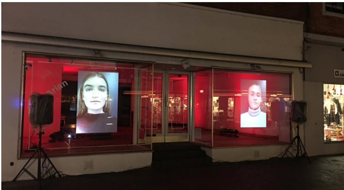
Butikslokale med farvet lys og video. Signe Klejs 2014

Via et kunstnerisk greb, kan man få udsigt til eller indsigt i et sted længere væk - og værket vil kunne skabe en fornyet nysgerrighed på Grenå Havn og det liv der udspiller sig der.