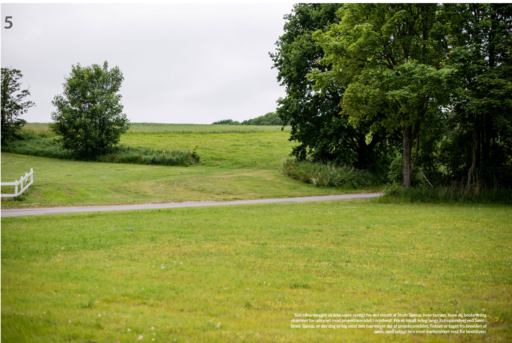
Solcelleanlægget vil ikke være synligt fra det meste af Store Sjørup, hvor terræn, huse og beplantning skærmer for udsynet mod projektområdet i nordvest. Fra et lokalt sving langs Estruplundvej ved Søen i Store Sjørup, er der dog et kig mod den nærmeste del af projektområdet. Fotoet er taget fra bredden af søen, med udsigt hen mod markstykket vest for landsbyen.