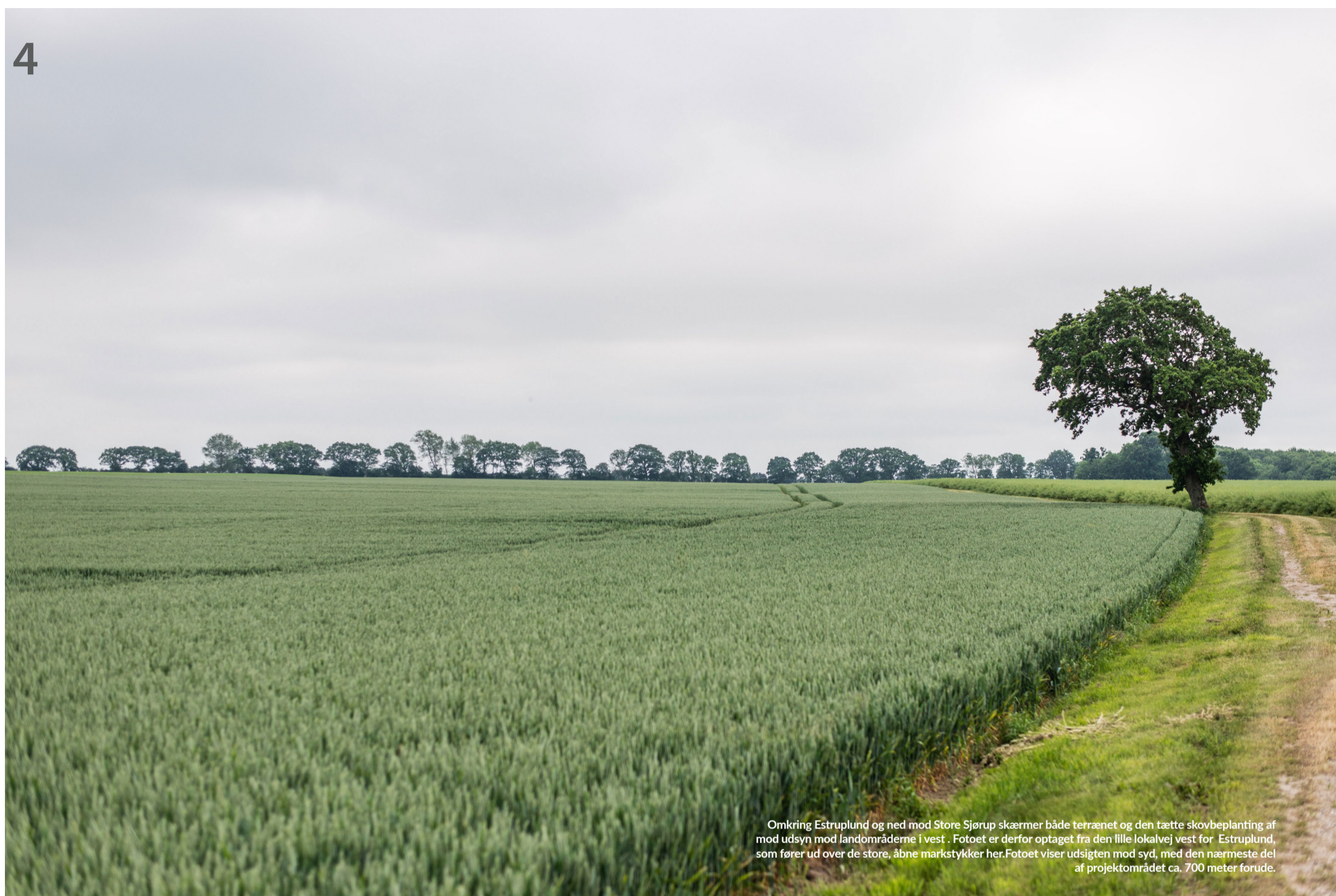
Omkring Estruplund og ned mod Store Sjørup skærmer både terrænet og den tætte skovbeplantning af mod udsyn mod landområderne i vest . Fotoet er derfor optaget fra den lille lokalvej vest for Estruplund, som fører ud over de store, åbne markstykker her. Fotoet viser udsigten mod syd, med den nærmeste del af projektområdet ca. 700 meter forude.