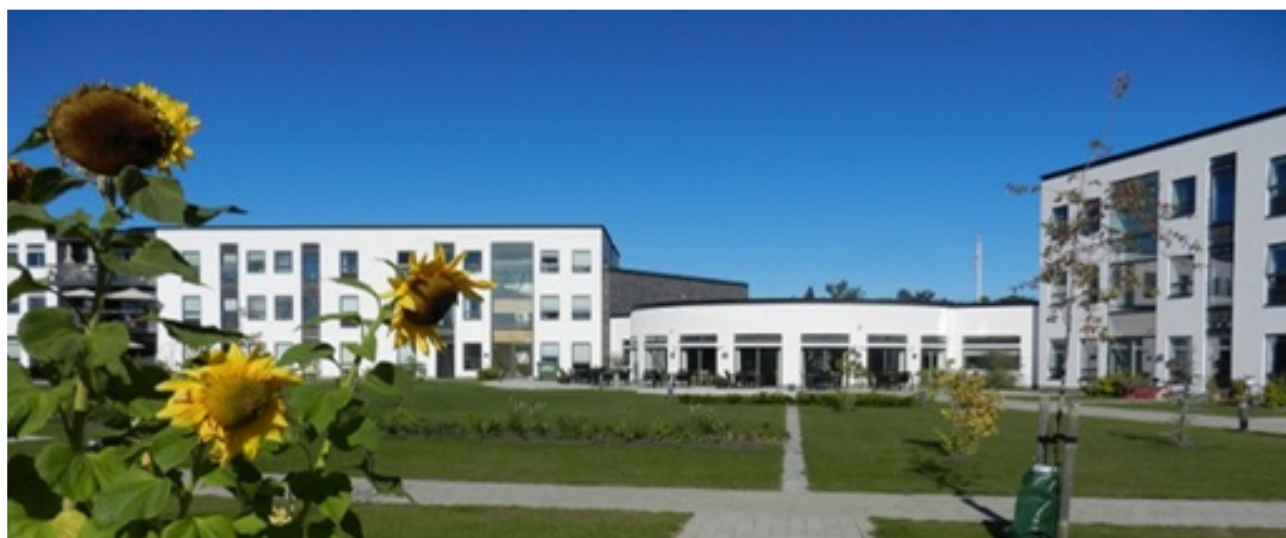
Plejecenter Violskrænten, Grenaa

Ældrerådet har et godt samarbejde med Handicaprådet om de trafikale problematikker, da mange interesser er sammenfaldne.