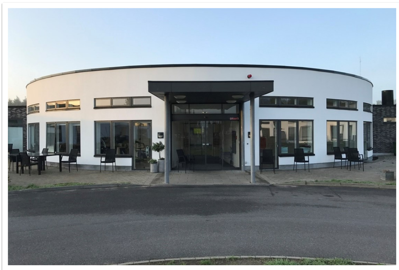
Glesborg Plejecenter, Glesborg

Ældrerådet udarbejdede et konstruktivt høringssvar til besparelserne, hvilket desværre ikke ændrede på beslutningerne.