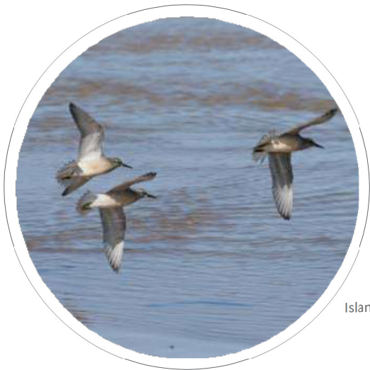
Islandske ryler over fjorden

Randers Fjord er præget af diger og pumpelag, som beskytter landbrugsjord og bebyggelser mod oversvømmelser fra fjorden. Pumpelagene har i dag fået en ny funktion, da de beskytter mod stormfloder, som sker i stigende grad med de nuværende og kommende klimaforandringer. Der er udfordringer i, at havvandet stiger. Det betyder, at digerne på sigt kommer til at danne kant til fjorden, og forlandet foran digerne forsvinder. Her ligger derfor en del overvejelser forude for, hvordan fjordlandskabet kan beskyttes og udvikles til fremtidens klimaudfordring.