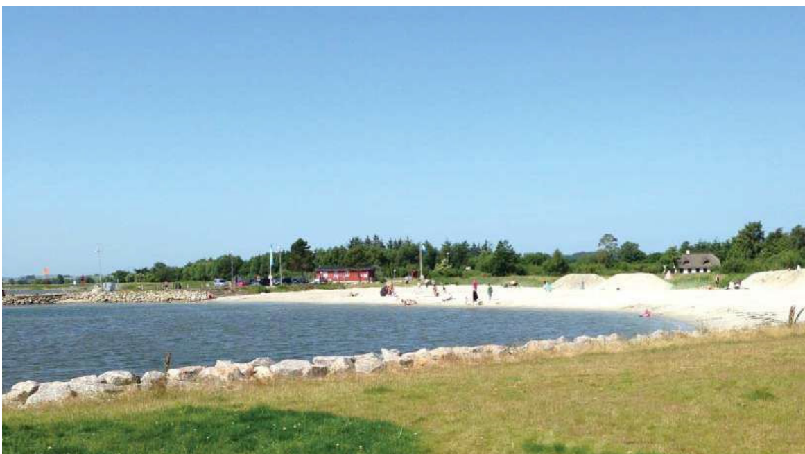
Strandliv ved Udbyhøj Nord

Randers Fjord egner sig flere steder også til sejlads med kano; specielt Grund Fjord har potentiale til en unik oplevelse i kano. I bunden af Grund Fjord møder man Alling Å. Her kan man sejle hele vejen øst på mod Allingåbro by, hvor den nye opholdsbro indbyder til velfortjent pause og picnic, inden der