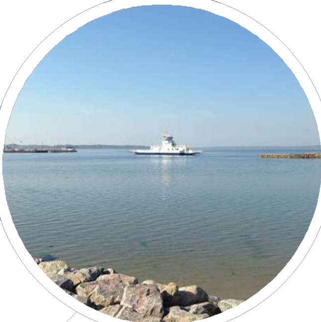
Kabelfærge ved Udbyhøj. Færgens historie kan føres tilbage til 1610

Randers Fjord har siden vikingetiden været en meget væsentlig adgangsvej til købstaden Randers og helt afgørende for, at man for mere end 1000 år siden placerede en by på stedet. Fra den store verden blev varer transporteret på fjorden ind til byen og fordelt til hele Midtjylland via Gudenåen og Nørreå. Den modsatte vej var fjorden de store Randerskøbmænds port til resten af verden, så deres skibe kunne bringe midt- og østjyske varer til Danmark, Europa og oversøiske lande. Fjorden og havnen er stadig af stor betydning for Randers.