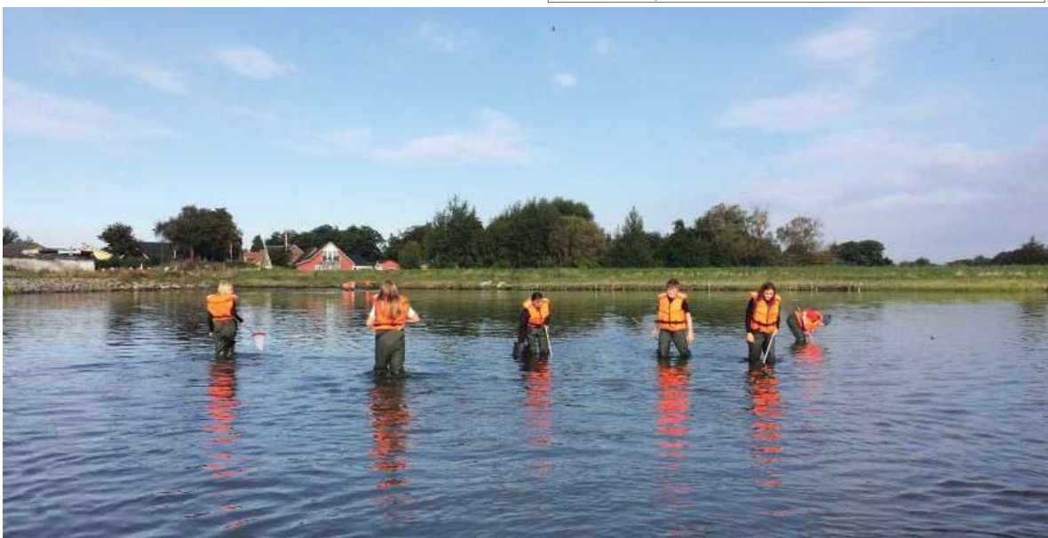
Naturparkguider i Randers Fjord