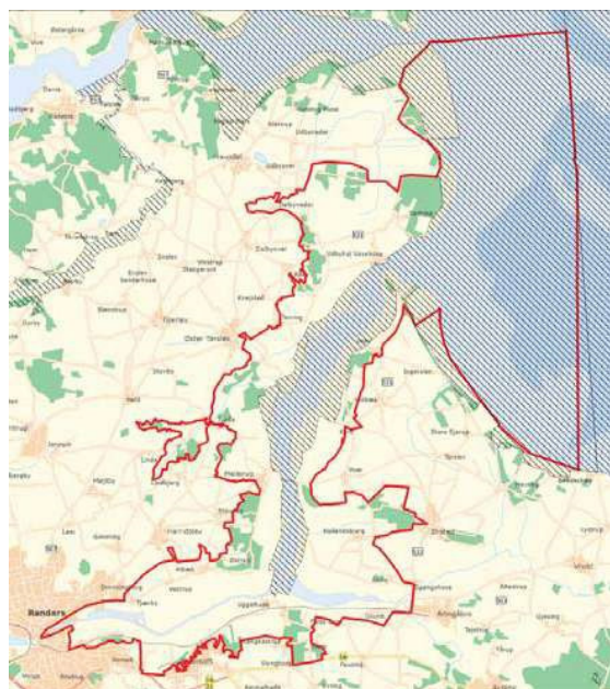
— Afgrænsning af naturparken Natura 2000 område

Naturpark Randers Fjord indgår i Natura 2000-område N14 Ålborg Bugt, Randers Fjord og Mariager Fjord. Et godt 72.000 ha stort område, der ligger langs Jyllands nordlige østkyst, og som strækker sig fra Randers Fjord til Lyngså i Nordjylland. I Natura 2000-området arbejdes der for at sikre, at de naturtyper og arter, som er udpeget til beskyttelse (udpegningsgrundlaget), opnår gunstig bevarings-