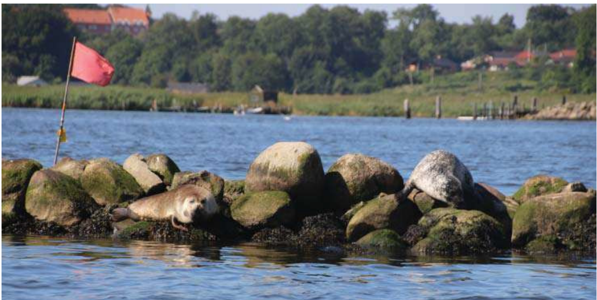
Sæler på opdagelse