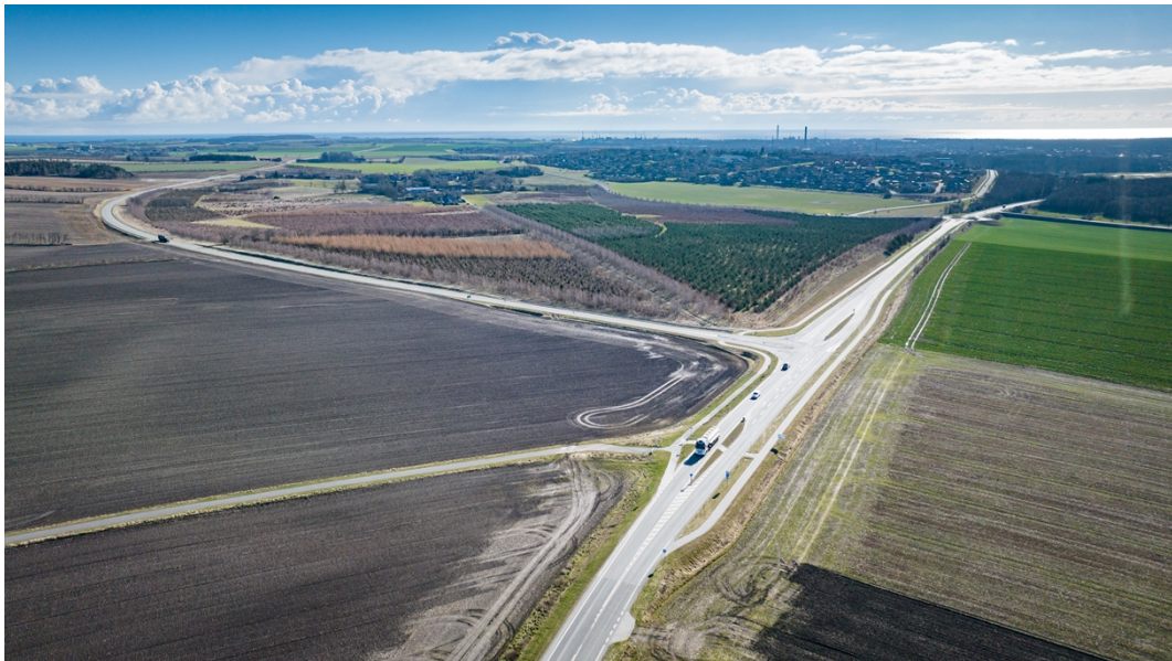
Dolmer Kildeskov set fra vest med Hovedvej R16 til højre, og Nordre Kattegatvej til venstre.

Vandcenter Djurs havde 140 elever fra Vestre Skole var med til at plante de første træer i foråret 2016.