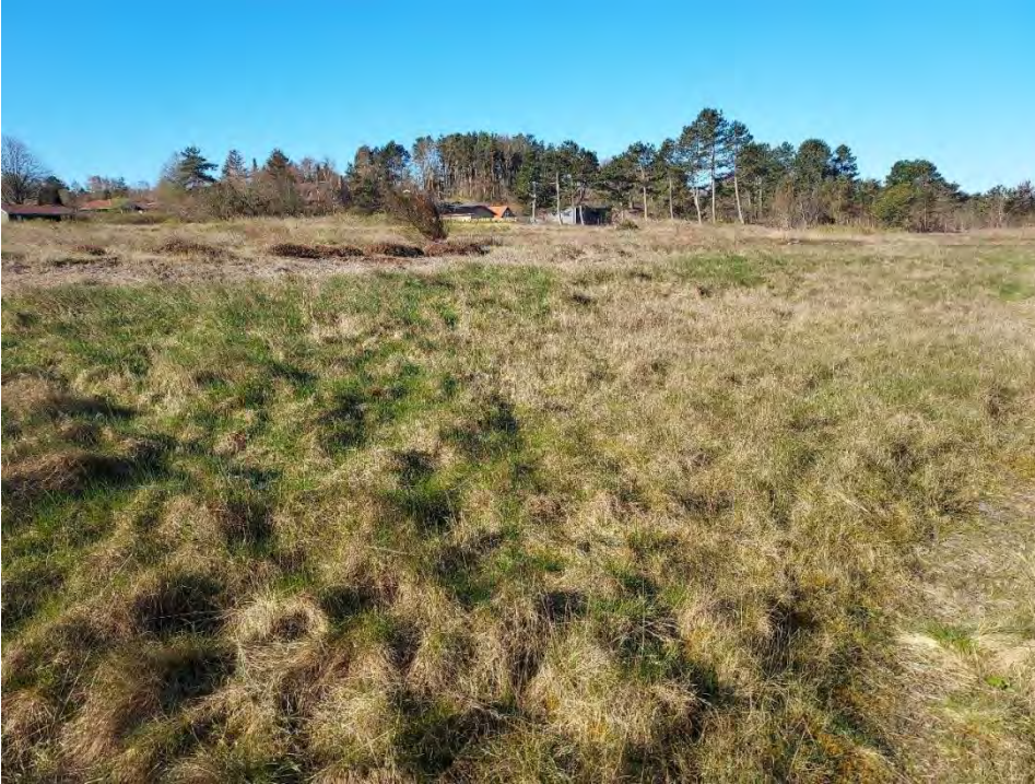
Foto 1: Område 1, lokalplanens delområde 1, set fra nordøst. Det fremgår, at vegetationen er tæt og dækker jordoverfladen. I baggrunden til venstre ses en af de bare pletter efter slåning af rynket rose, der i sig selv er velegnet til yngle-/rasteområde for markfirben.