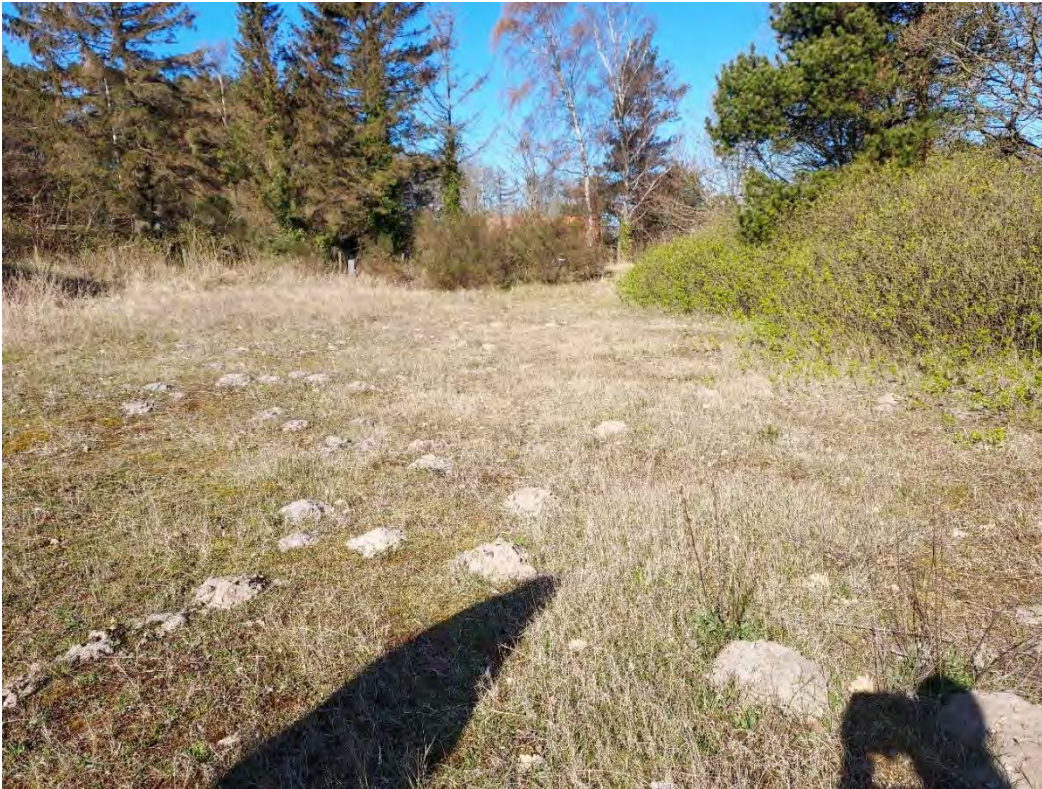
Foto 9. Den øst-vestgående jordvold set fra øst. Dens sydvendte side vil kunne ryddes for rynket rose og genopbygges som et meget velegnet yngle-og rasteområde for markfirben

Hvis denne jordvold ved opgravning ryddes for rynket rose, hvorefter overskudsjoeden fra byggeri i område 2 anvendes til at genopbygge volden, nu blot i en ubevokset, soleksponeret tilstand, vil den udgøre et yngle- og rasteområde af højere kvalitet end det, der forsvinder ved byggeriet.