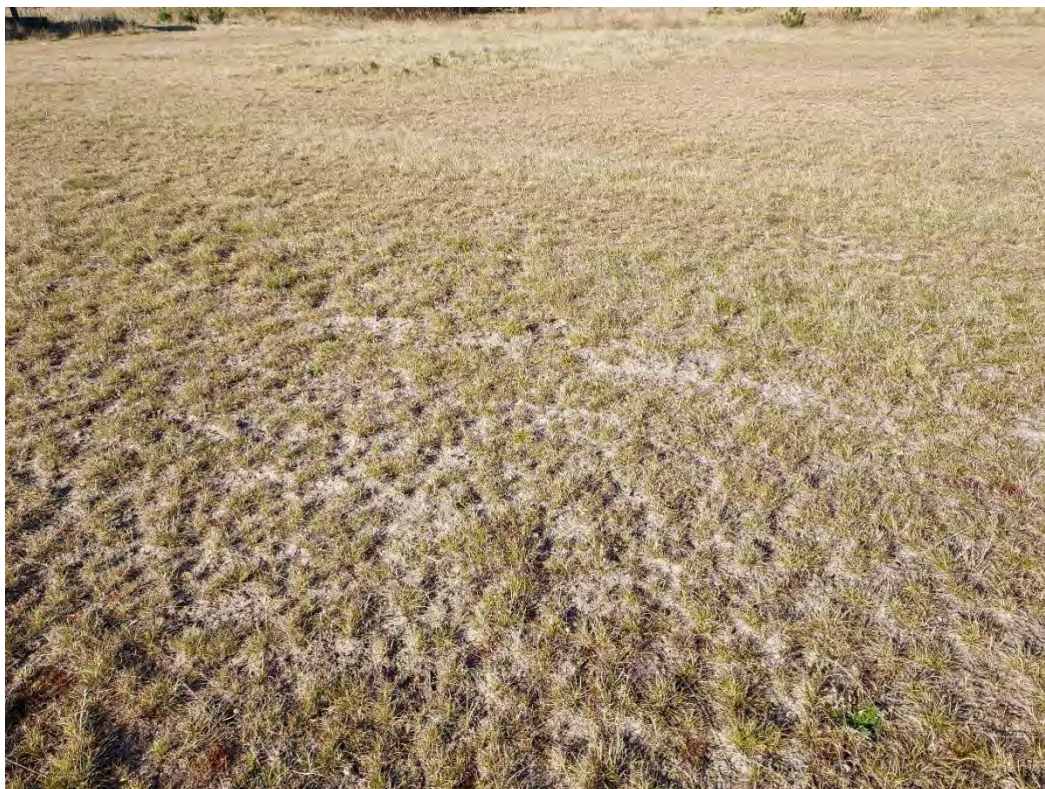
Foto 5: Matr. nr. 1bp, hvor der tidligere har stået en bygning. Jorden er hårdt stampet og tilsået med rød svingel. Dette område er for monotont til at være yngle-/ rasteområde for markfirben.