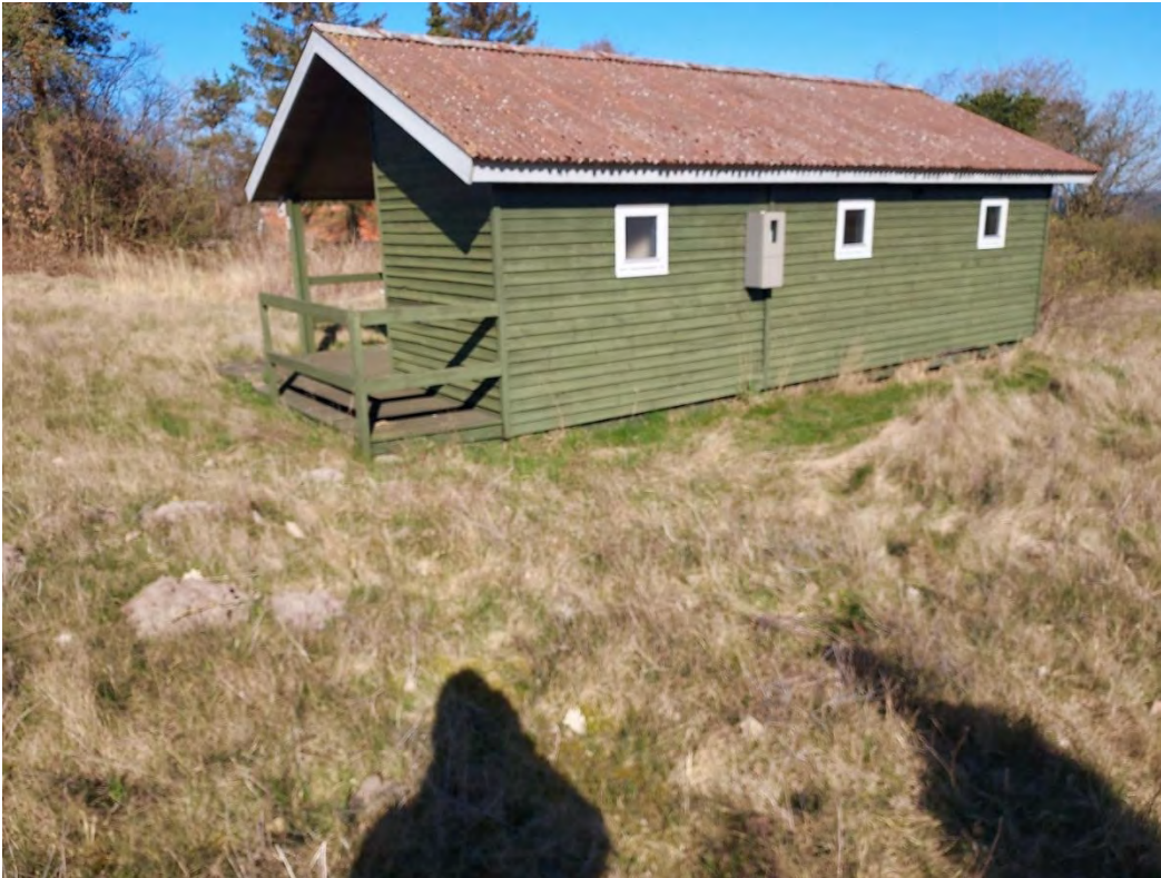
Foto 7: Græsdomineret område på matr. nr. 1 længst mod sydvest. Græsset er for langt og tæt til at området er egnet som yngleområde. Kun langs soklen er der egnede solbadepladser, men området mangler solvarm sandbund, hvor markfirben kan lægge æg.