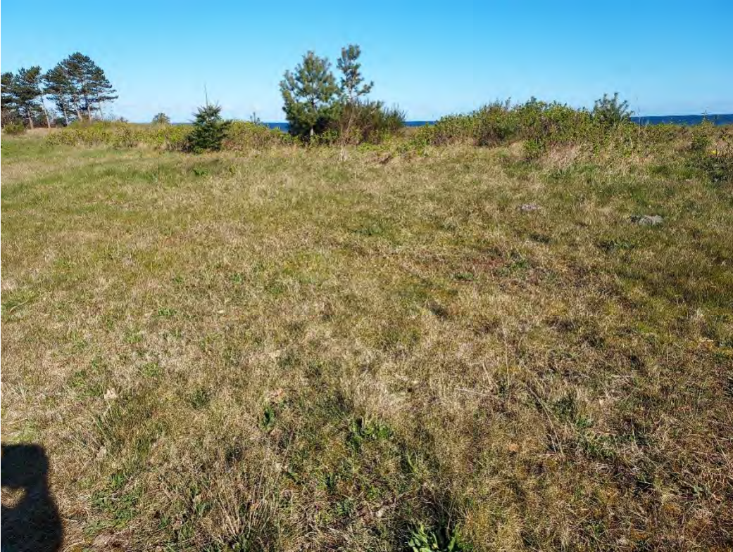
Foto 4: Område 3, set fra sydvest. Området hælder svagt mod syd og er derfor en god solbadeplads, der er velegnet som yngle-/rasteområde.