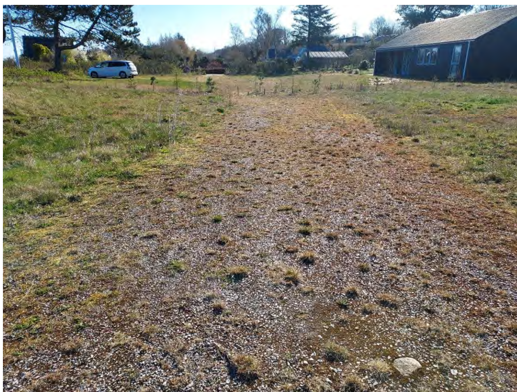
Foto 6: Tidligere vej. Jordbunden er for hård til at være egnet som yngle-/rasteområde. Det velegnede område 3 ses til venstre i billedet.