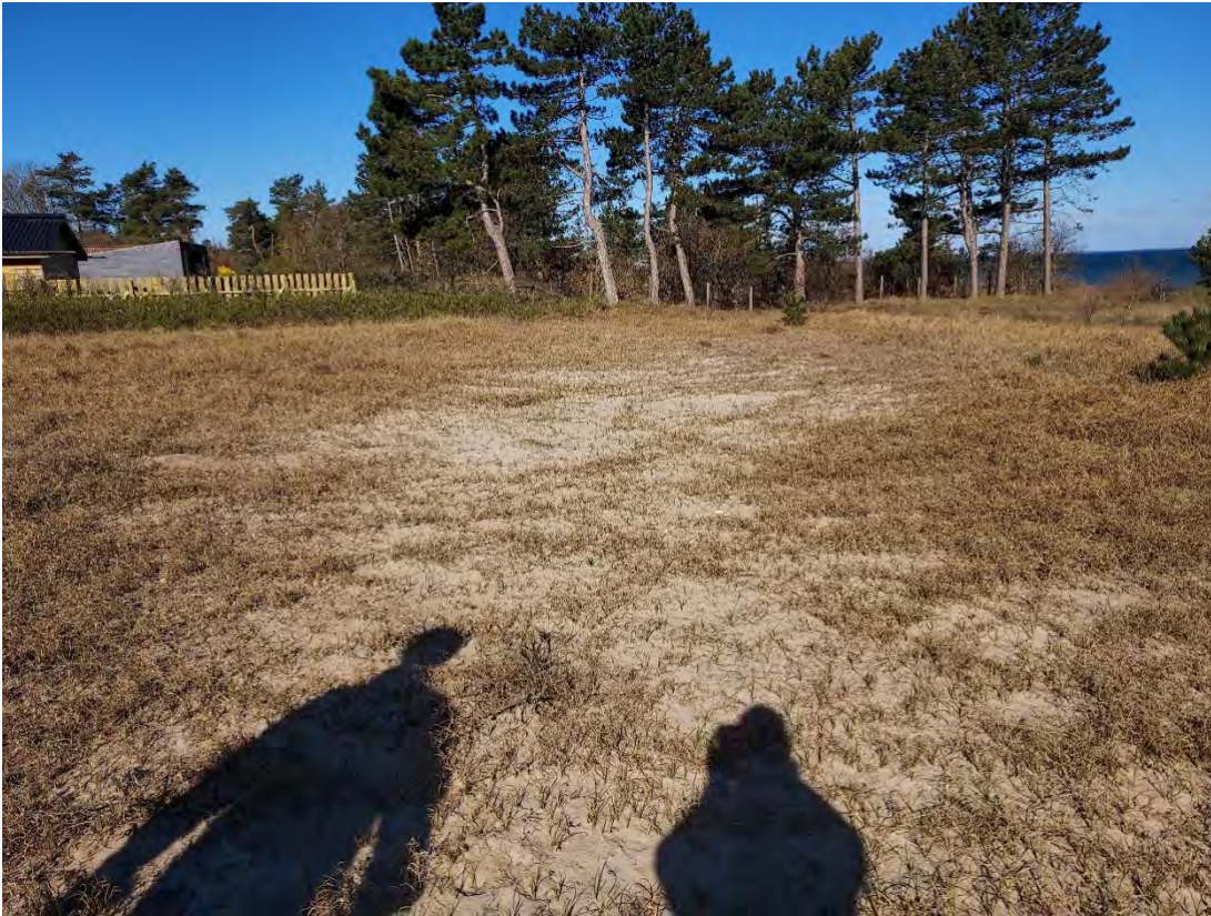
Foto 3: Område 2. Bemærk mosaikstrukturen, hvor åben, soleksponeret sandjord støder op til tættere vegetation af sandstar, dværgbuske og krat, der giver skygge. Området er velegnet som yngle-/rasteområde for markfirben.

Den nordlige del af matr. nr. 1br er flad, men fremstår med løs sandjord og en åben vegetation domineret af sandstar med kort afstand mellem bare sandpletter og tættere vegetation. Området har nærmest karakter af klit og er velegnet som yngle-/rasteområde for markfirben.