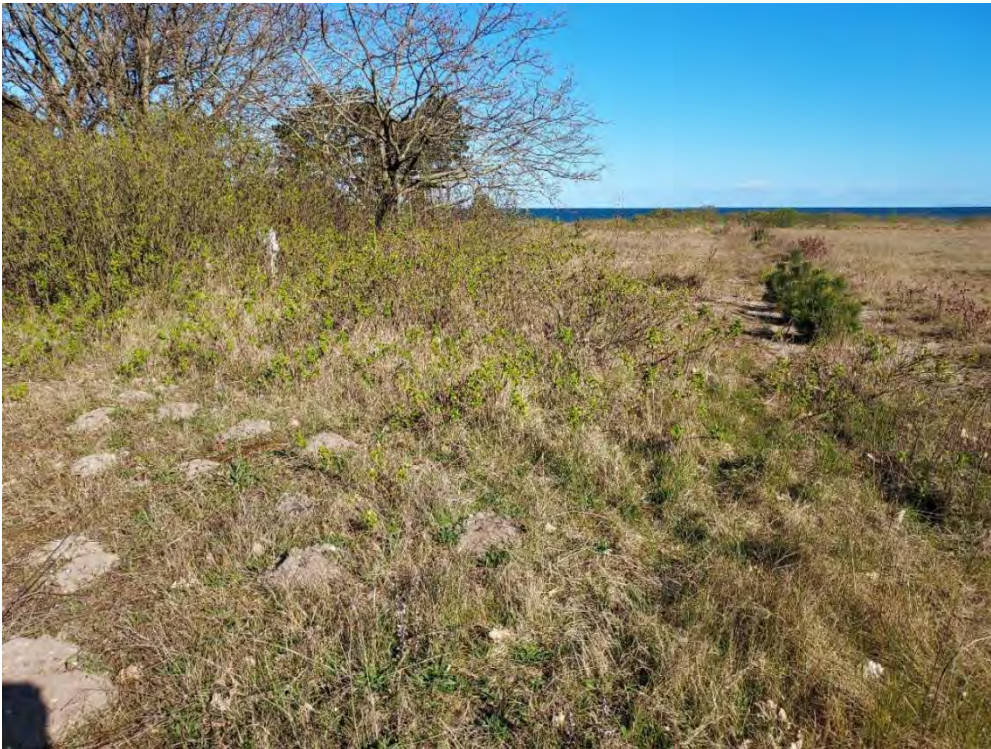
Foto 8. Østlige ende af jordvold syd for område 2, set mod nord.

I den sydlige del af matriklen ligger en sydvendt jordvold, der er bevokset med nåltræer og rynket rose. Denne vold fremgår af foto 8 og 9: