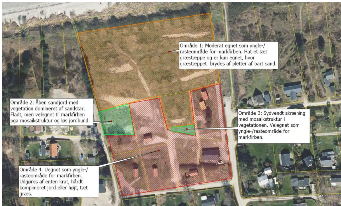
Kort 1: Inddeling i de 4 områder.

Lokalplanen skal muliggøre en bebyggelsesprocent på 15, svarende til ca 180 m 2 pr. grund. Hertil kommer parkeringsareal, men resten af områderne lades urørt. Samtidig forbyder planen byggeri nærmere skel end 5 meter. Lars Vognsen har oplyst, at byggefelterne vil blive placeret indenfor områderne vist med sort på kort 2, men uden dog at fylde dem ud: