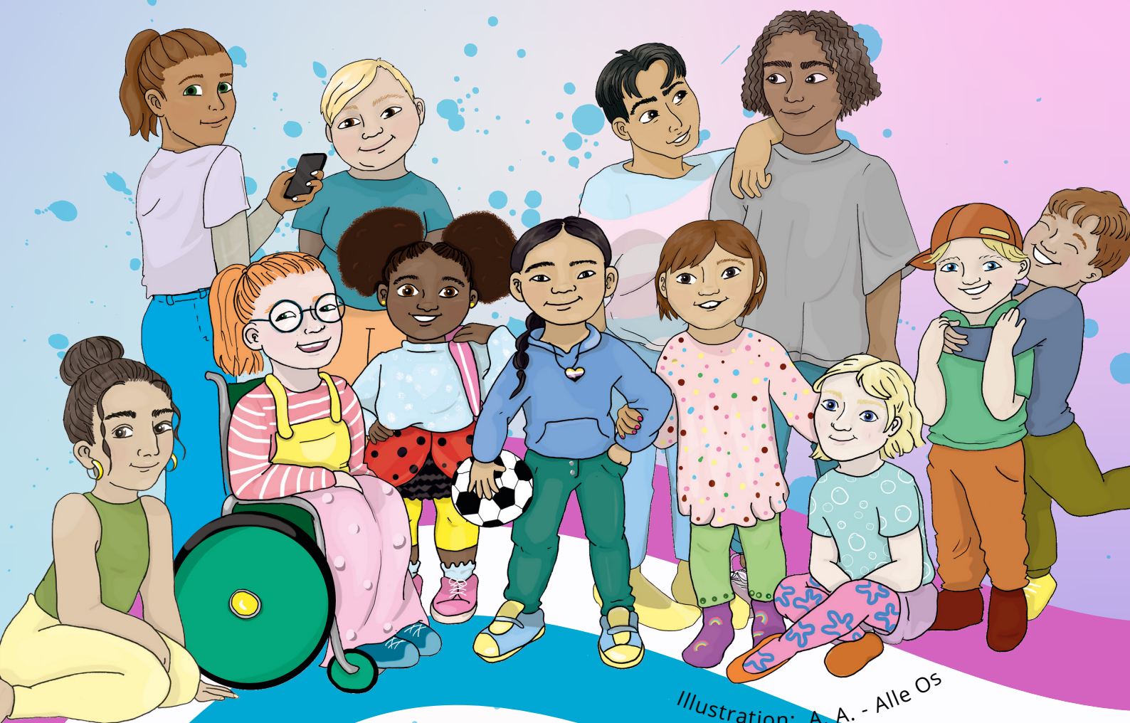
Illustration: A. A. - Alle 05

En guide til fagprofessionelle i skoler, fritids- og ungdomsklubber og foreningslivet