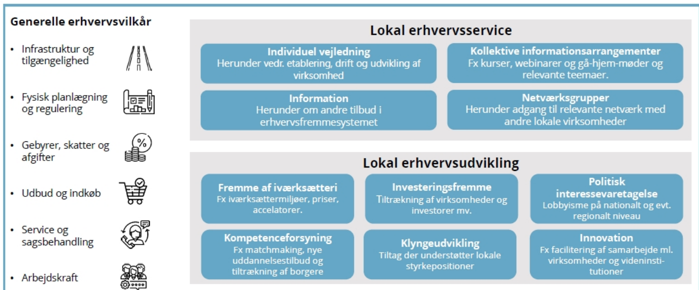
Figur 1, viser virkemidler i den lokale erhvervsindsats indenfor områderne generelle erhvervsvilkår, lokal erhvervsservice og lokal erhvervsudvikling:

uden for kommunen, når det gælder erhvervspolitiske satsninger, til eksempel Business Region Aarhus og EU-kontoret. Opmærksomheden på mulighederne for at tiltrække regionale, nationale og internationale investeringer og ressourcer er vigtig. Det gælder ikke mindst i forhold til mere langsigtede udviklingsopgaver og muligheder. På den måde rækker egne ressourcer længere.