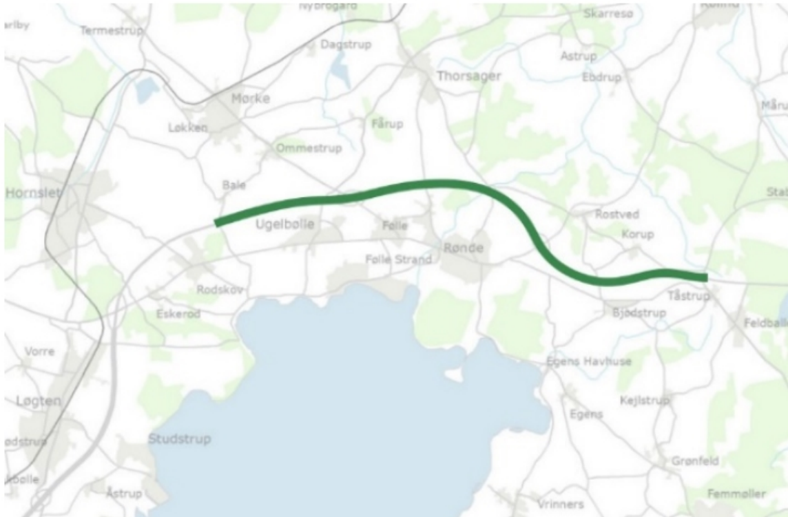
Den foreslåede opgradering af rute 15 mellem Bale og Tåstrup til 2+1 motortrafikvej vil følge eksisterende linjeføring, som det kan ses på ovenstående kort.