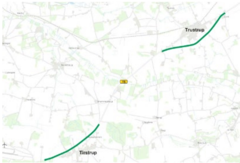
På kortet ovenfor ses de foreslåede omfartsveje nord om Tirstrup og syd om Trustrup

Vejdirektoratet har oplyst Norddjurs Kommune, at kommunerne vil blive kontaktet når forberedelserne til omfartsvejene igangsættes i 2026-2027.