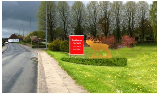
EFTER: Hjorten flyttes ca. 40 m mod syd, så den kommer ind i Byparken. Hækplanterne bortskaffes. Ny Takshæk plantes. Hjorten flyttet bagud og op i Taks-hæk. Ny fast stålramme til informationsbanner.