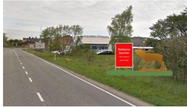
EFTER: Hjorten er flyttet ind mod byen til matr. 13db. Ny fast stålramme til informationsbanner. Hækplanterne bortskaffes. Ny Takshæk plantes.