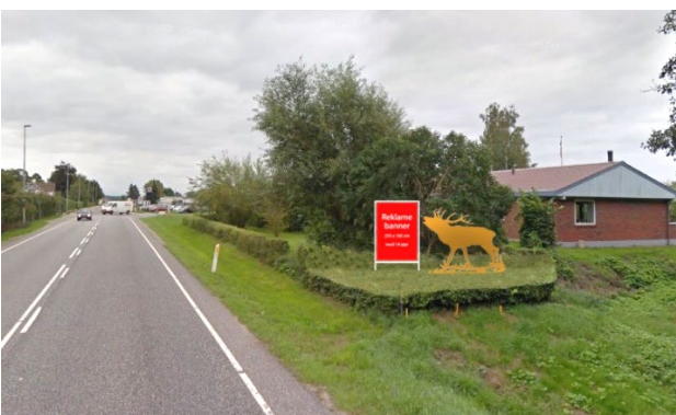
EFTER: Hækplanterne bortskaffes. Ny Takshæk plantes. Hjorten flyttet til højre. Ny fast stålramme til informationsbanner.