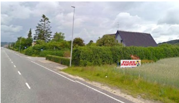
FØR: Hjorten med informationsbannere i Østergade.