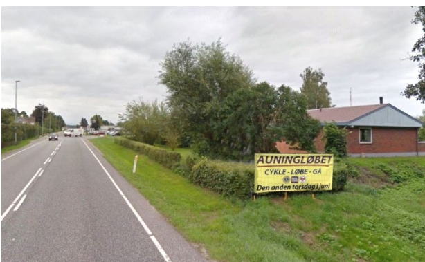
FØR: Hjorten med informationsbannere i Vestergade.