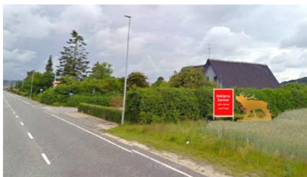
EFTER: Hækplanterne bortskaffes. Ny Takshæk plantes. Hjorten flyttet til højre. Ny fast stålramme til informationsbanner.