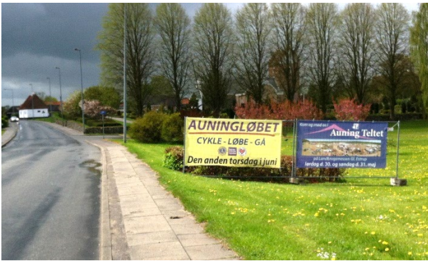
FØR: Hjorten med informationsbannere i Kirkegade.