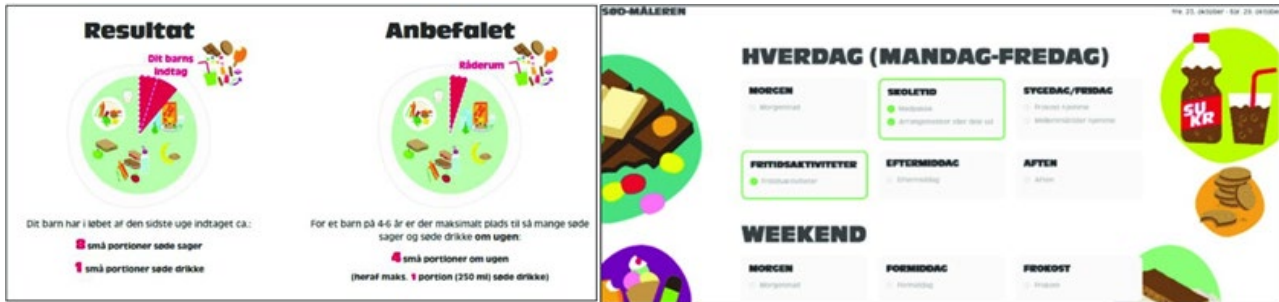
Udsnit af feedback fra SØD-måleren

Udover samtalen hos sundhedsplejersken eller tandlægen om søde vaner baseret på SØD-målerens resultat og den opfølgende årlige SØD-måling, forpligter de deltagende kommuner sig til at arbejde med søde vaner på et mere overordnet niveau. Kommuner arbejder forskelligt og der er derfor heller ikke en fast aktivitetsportefølje for kommunerne. Kommunerne forpligter sig til at udarbejde en årlig handleplan, hvori de beskriver, hvordan de arbejder med "Er du for sød?". Eksempler på, hvad kommunerne kan medtage i deres handleplan: