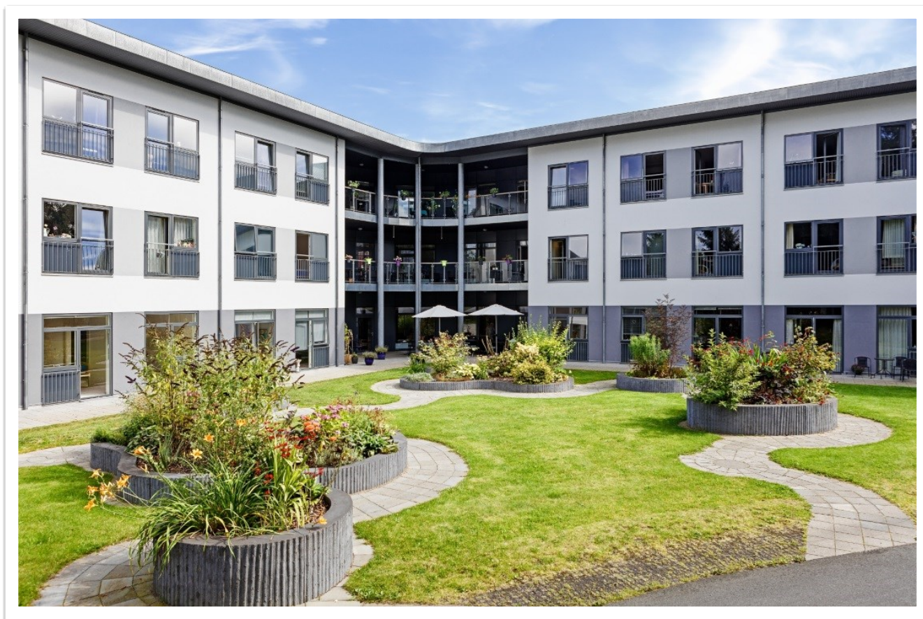
Plejecenter Digterparken, Grenaa

Dette uddybes nærmere under fokusområder.