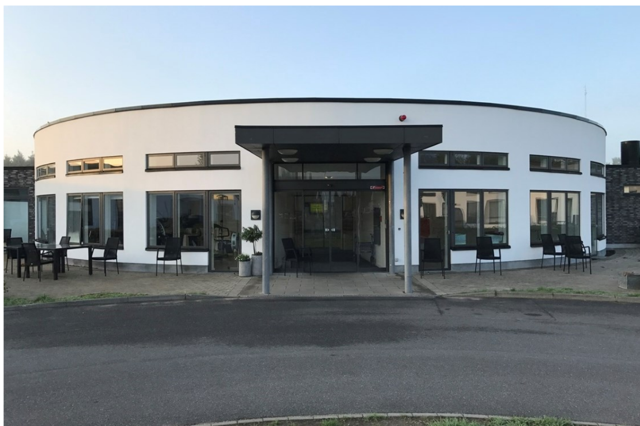
Glesborg Plejecenter, Glesborg

Ældrerådet udarbejder altid konstruktive høringsvar, når der meldes besparelser.