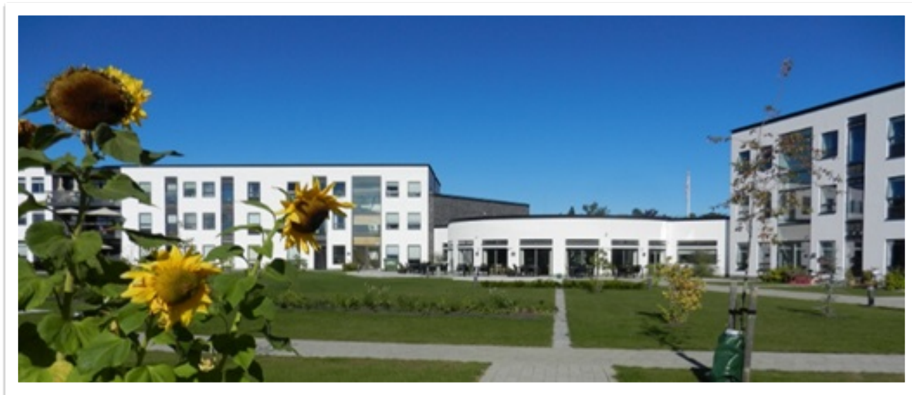
Plejecenter Violskrænten, Grenaa

Ældreområdet har været skånet for større besparelser i 2024.