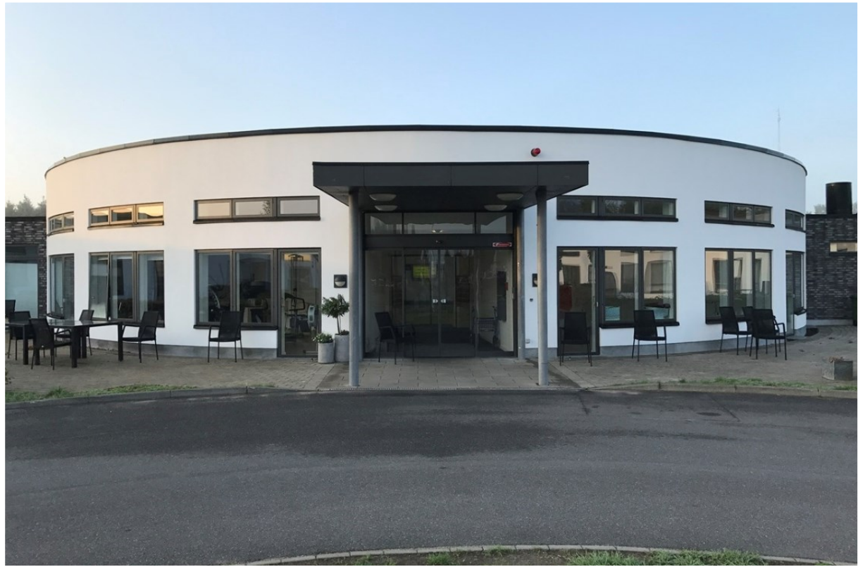
Glesborg Plejecenter, Glesborg

Små teams er nu opstartet i hele hjemmeplejen og det følges tæt.