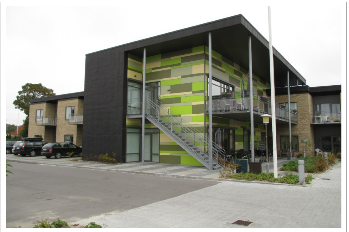
Plejecenter Møllehjemmet, Auning

Ældrerådet følger implementeringen af Ældrereformen og Sundreformen tæt. Sundhedsreformen er vedtaget i november 2024 og gælder fra den 1. januar 2027.