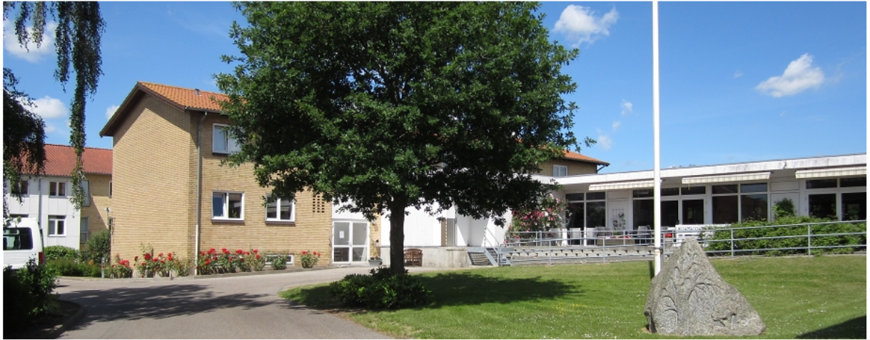
Plejecenter Farsøhthus, Allingåbro

Ældrerådet har et tæt samarbejde med politikere og forvaltning. Det er altid let at få kontakt, når der er behov.