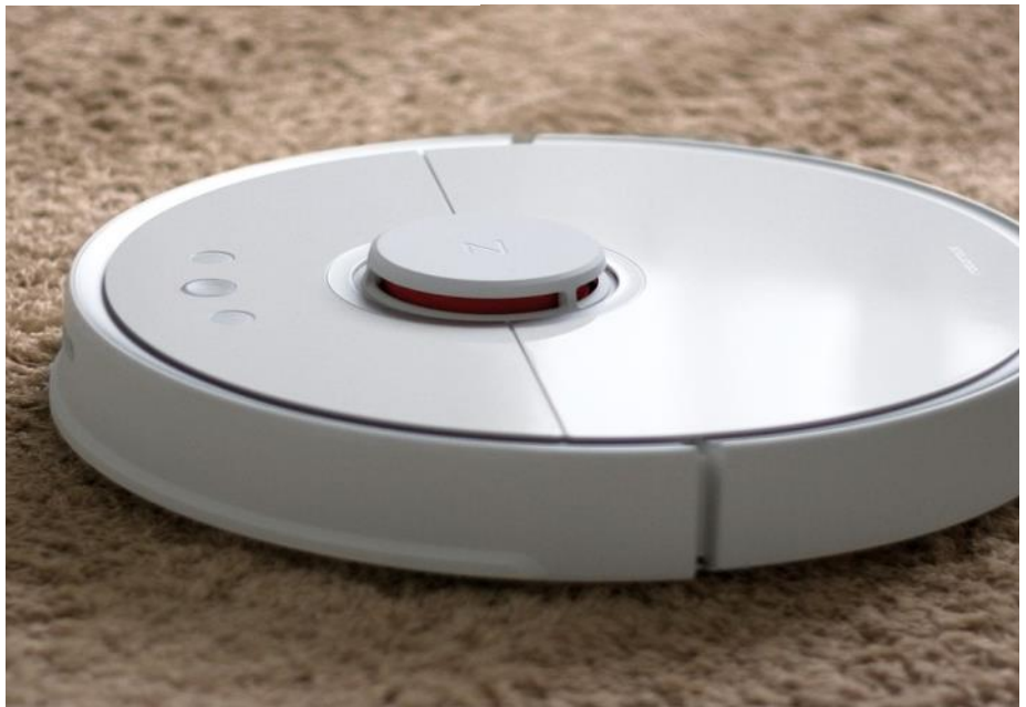
Stadig flere kommuner pålægger hjemmehjælpsmodtager at købe en robotstøvsuger. Nu er der også forslag i kommuner om, at hjemmehjælpsmodtagere skal anskaffe sig en robotgulv-vasker.

I Faaborg-Midtfyn Kommune planlægger man at gå endnu længere i anvendelsen af robotter til rengøring. Ikke alene skal borgerne anskaffe sig en robotstøvsuger. De skal også anskaffe sig en robotgulvvasker. Forventningen er, at de to teknologier skal stå for al støvsugning og gulvvask hos 70 procent af de borgere, der er visiteret til rengøring