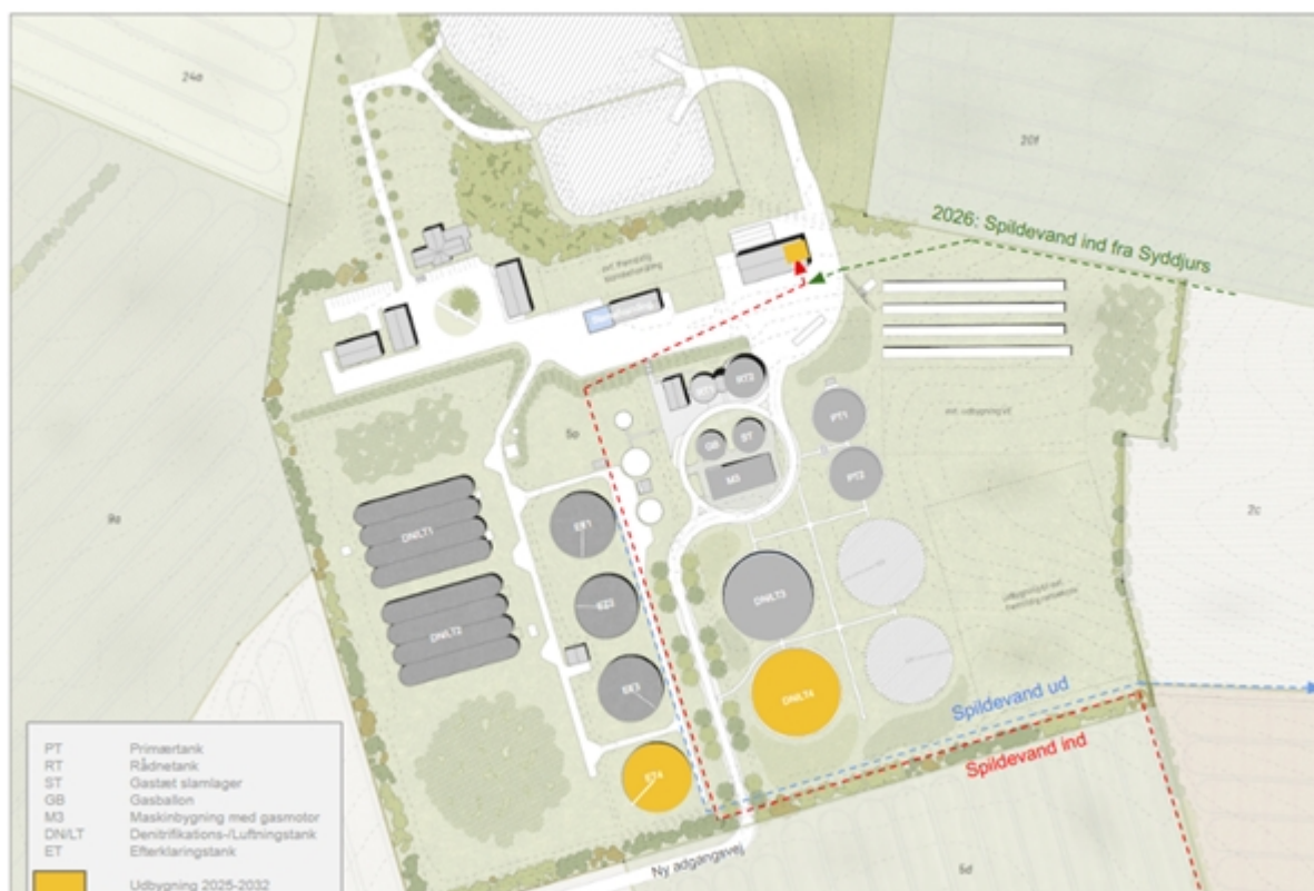
Figur 1: Oversigtsplan over udvidelse af Fornæs Renselanlæg fra 2026

Den gældende kommuneplan og lokalplan for Fornæs Renselanlæg indeholder muligheden for at udvide renselanlægget.