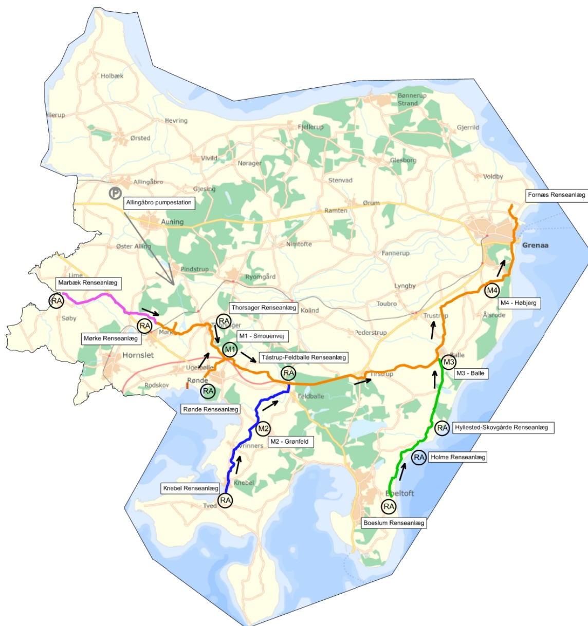
Figur 3: Oversigtsplan med renseanlæg, som planlægges nedlagt, og kommende transportanlæg frem til Fornæs Renseanlæg, med angivelse af fase 1 (orange), fase 2 (grøn), fase 3 (blå) og fase 4 (lyserød).

Udbygningen af Fornæs Renseanlæg for den kommende centralisering er planlagt i 2026, mens transportanlægget forventes udlagt i fem etaper, som det fremgår nedenfor.