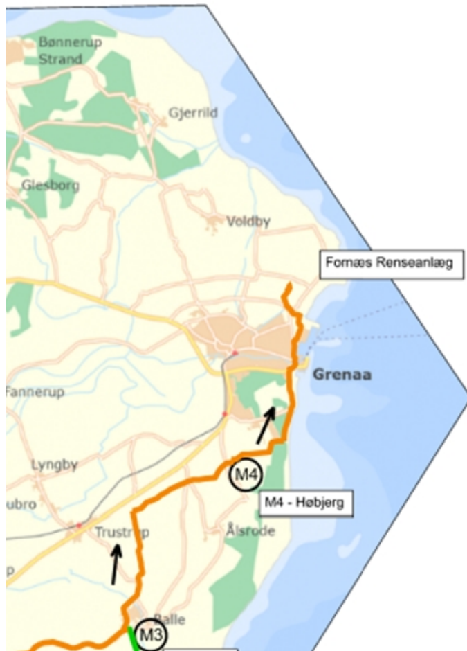
Figur 2: Oversigt over den del af det nye transportanlæg, som ligger i Norddjurs Kommune. Der henvises til mere detaljeret kort i bilaget.

Dette tillæg til spildevandsplanen medtager dog kun de matrikler, der ligger i Norddjurs Kommune.