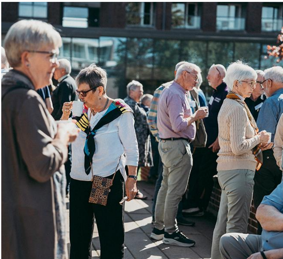
Landets knap 1.000 ældre- og seniorrådsmedlemmer er med til at trække statistikken op over andelen af danskere, der arbejder frivilligt.

mel omsorg, hvor man hjælper venner, bekendte, naboer eller den udvidede familie med forskellige gøremål som at købe ind, passe børn, gøre rent eller lave havearbejde.